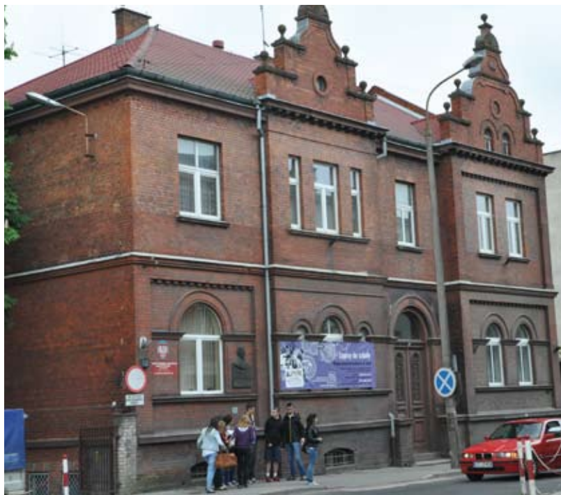
Budynek siedziby Państwowej Szkoły Muzycznej I stopnia w Starogardzie Gdańskim, który powstał r 1888 roku.