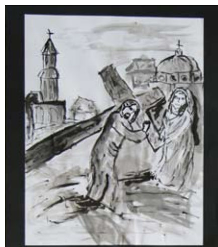
Praca Moiniki Laser - nagrodzonej w 2013 roku w kategorii klas IV - VI szkół podstawowych.

Ognisko Pracy Pozaszkolnej w Starogardzie Gdańskim zaprasza do udziału w corocznych wielkanocnych konkursach. Organizujemy dwa konkursy o tematyce Wielkanocnej. Jednym z nich jest X Ogólnopolski Kociewski Konkurs na Pisanek Wielkanocną. Jego celem jest propagowanie tradycji i folkloru kociewskiego, związanego ze świętami wielkanocnymi. Konkurs stwarza okazję do indywidualnej działalności artystycznej oraz wymiany wiedzy na temat zanikającego zwyczaju własnoręcznego zdobienia pisanek. Uczestnikami tego konkursu