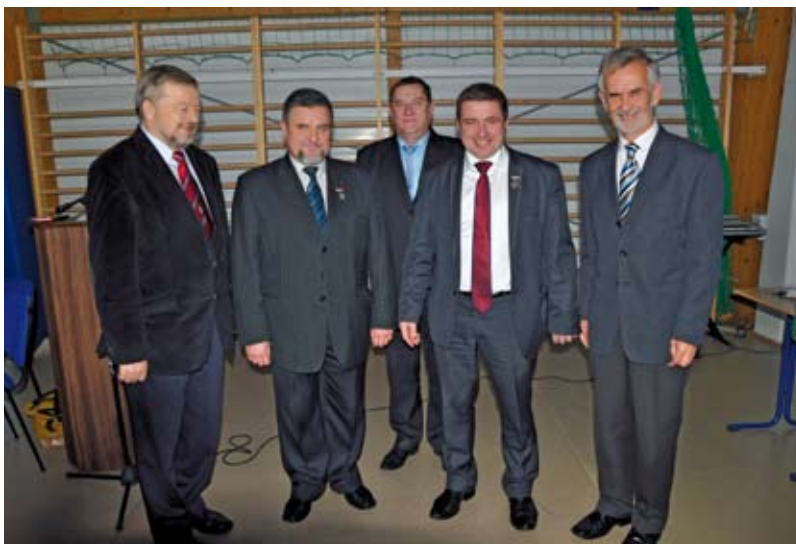
Pamiątkowe zdjęcie odznaczonych medalem „Zasłużony dla rolnictwa” z senatorami i wicestarostą.

zaproszono m.in. Senatora RP Andrzeja Grzybą, który przedstawił zebrany obecny stan prac nad zmianą ustaw o podatku dochodowym od osób fizycznych oraz o swobodzie działalności gospodarczej, w kontekście sprzedaży przez rolników przetworzonych produktów rolnych, w formie tzw. sprzedaży bezpośredniej. Chodzi tu m.in. o możliwość legalnej i uregulowanej sprzedaży regionalnych wyrobów spożywczych przez koła gospodyń wiejskich, kwatery agroturystyczne, czy poszczególnych rolników. O Funduszu Sołeckim, jako szansie na rozwój wsi referował Senator RP i Prezes Krajowego Stowarzyszenia Sołtysów Ireneusz Niewiarowski. W swoim wystąpieniu senator zaprezentował szereg ciekawych przykładów inicjatyw społecznych i projektów, zmieniających oblicze polskiej wsi. Natomiast dr Daniel Roszak z Pomorskiego Oddziału Doradztwa Rolniczego w Gdańsku przedstawił istotę i najważniejsze zmiany w zasadach dofinansowania z funduszy unijnych w ramach Programu Rozwoju Obszarów Wiejskich na lata 2014 – 2020, w którym ocenił szanse, zagrożenia i perspektywy dla naszych rolników, którzy będą beneficjentami tego programu. Dotychczasowe osiągnięcia w pozyskiwaniu funduszy unijnych na rozwój obszarów wiejskich zaprezentował Marian Furgon – Prezes Stowarzyszenia Lokalna Grupa Działania „Chata Kociewia”. Swoje doświadczenia za-