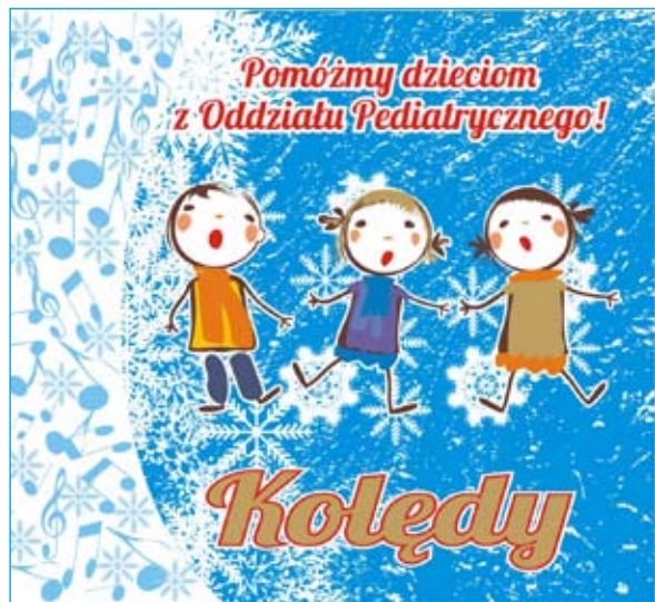
Okładka płyty z koledami i pastorałkami - cegiełka w akcji charytatywnej Fundacji Św. Jana.

w realizacji której swój udział ma również grupa muzyczna dzieci z Ogniska Pracy Pozaszkolnej rozprowadzana będzie w formie „cegiełki” m.in. w starogardzkich parafiach. Koszt zakupu płyty wynosi 15 zł, a całkowity dochód z jej sprzedaży zostanie przeznaczony na remont sal chorych oddziału pediatrycznego starogardzkiego szpitala. Płyta jest już dostępna w siedzibie Fundacji (budynek administracji Kociewskiego Centrum Zdrowia Sp. z o. o. w Starogardzie Gdańskim ul. Bałewskiego 1), w Punkcie Informacyjnym Starostwa Powiatowego w Starogardzie Gdańskim oraz w Ognisku Pracy Pozaszkolnej. Zachęcamy wszystkich, którzy chcą wesprzeć finansowo tę inicjatywę do zakupu płyty, która może być miłym upominkiem na zbliżające się święta Bożego Narodzenia.