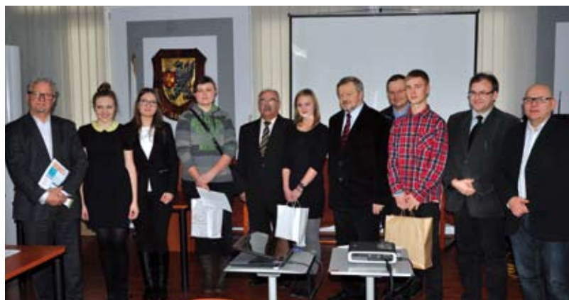
Laureaci konkursów zorganizowanych w ramach KAC wraz z członkami Jury i organizatorami.