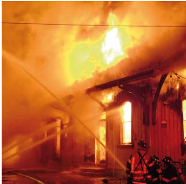
Strażacy ostrzegają – przez nieostrożność świąt mogą się zamieć w tragedię.