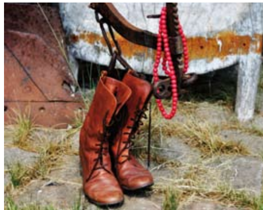
Fotografia z okładki albumu.