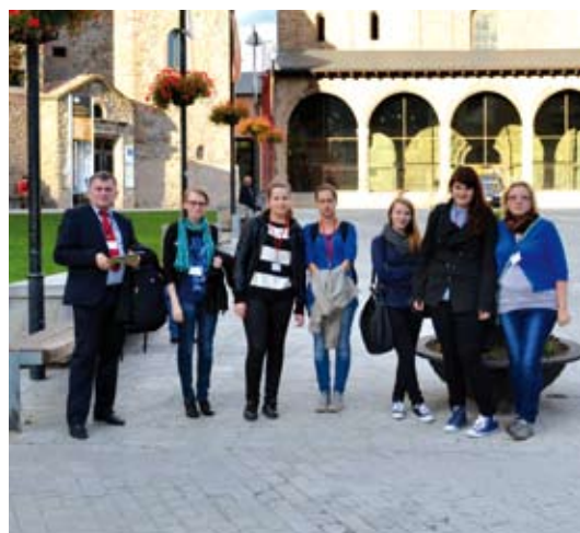
Uczniowie ZSE w Starogardzie Gdańskim wraz z opiekunami.

Celem projektu jest wymiana doświadczeń i poznanie kultur krajów uczestniczących w tym przedsięwzięciu. Efektem projektu będzie stworzenie produktu końcowego, który będzie owocem wspólnej pracy wszystkich uczestników. Powstanie strona internetowa, album Picassa, blog oraz różnego rodzaju prezentacje, filmy i wystawy. Stworzone publikacje będą ukazywać różnorodność kultur europejskich. Uczniowie wraz z nauczycielami będą szukać wspólnych korzeni łączących poszczególne kraje na płaszczyźnie historii, kultury, języka oraz filozofii i tradycji. Głównym zadaniem uczestników projektu będzie odnalezienie różnic i podobieństw, jakie występują w tym zakresie w tych krajach. Pozwoli to przede wszystkim młodym ludziom zrozumieć, a przez to i uszanować mieszkańców krajów o odmiennej kulturze, co powinno charakteryzować świadomych obywateli Europy. Projekt ma pomóc zbudować pomost między różnymi krajami, ma kształcić umiejętność odczuwania empatii oraz uczyć