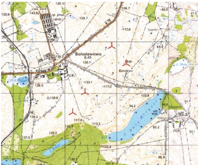
Mapa przedstawiająca planowaną lokalizację wiatraków.