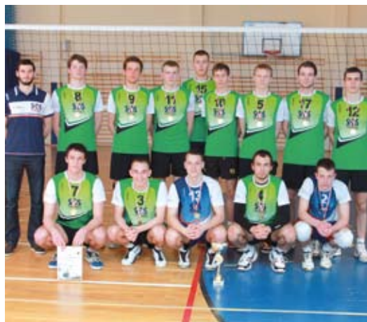
Zdobywcy pierwszego miejsca turnieju – SMS nr 2 z Gdańska.

W dniu 08.04.br. w hali sportowej ZSE w Starogardzie Gdańskim odbyły się finały Wojewódzkiej Licealiady Młodzieży Szkolnej w Piłce Siatkowej Chłopców. Organizatorami rozgrywek byli: Międzyszkolny Ośrodek Sportowy w Starogardzie Gd., Wojewódzki Szkolny Związek Sportowy w Gdańsku oraz II LO Starogard Gd. W zawodach udział wzięło 6 najlepszych drużyn województwa pomorskiego, które zostały wyłonione podczas turniejów półfinałowych.