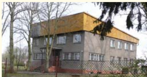
Budynek główny o powierzchni 371.5 m 2

Piąty przetarg odbędzie się w dniu 5 czerwca 2013 r. o godz. 11:00 w siedzibie Starostwa Powiatowego w Starogardzie Gdańskim, ul. Kościuszki 17, sala nr 210.