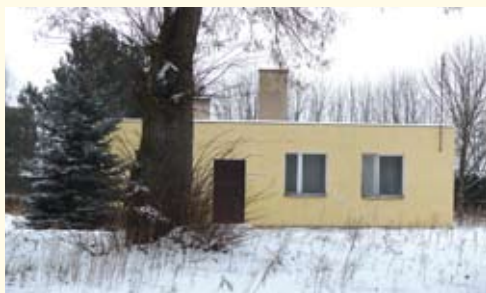
Budynek pomocniczy o powierzchni 127.1 m 2

Cena wywoławcza 530.000,00 zł (słownie: pięćset trzydzieści tysięcy złotych). Sprzedaż zwolniona z podatku VAT.