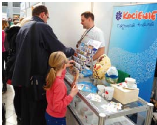
Stoisko LOT KOCIEWIE w Toruniu.