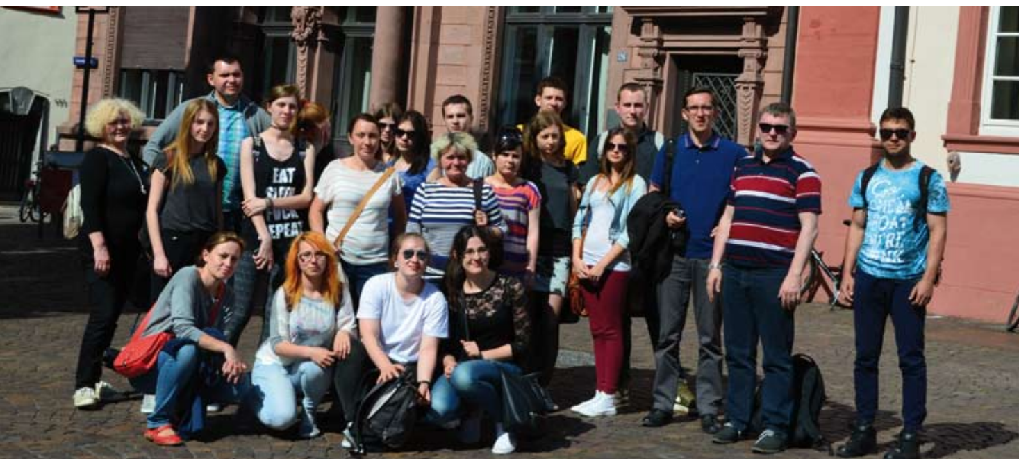
Grupa uczniów i nauczycieli, uczestników projektu na tle najstarszego uniwersytetu w Niemczech, w Heidelbergu.

Nad prawidłowym przebiegiem projektu czu-