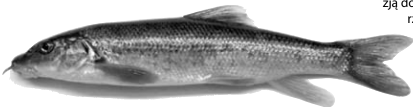
Brzanka Barbus peloponensius

W obrębie obszaru występuje 9 gatunków zwierząt wymienionych w Załączniku II Dyrektywy Siedliskowej: bóbr Castor fiber , wydra Lutra lutra , różanka Rhodeus sericeus amarus , piskorz Misgurnus fossilis , koza Cobitis taenia , głowacz białopłetwy Cottus gobio , brzanka Barbus peloponensius , minóg strumieniowy Lampetra planeri i motyl czerwoczyk nieparek Lycaena dispar .