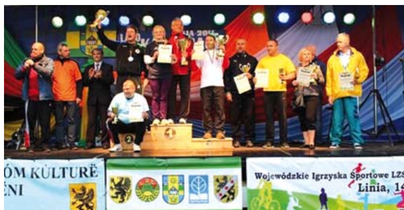
Laureaci zeszłorocznych Wojewódzkich Igrzysk LZS w Linii.

W dniu 13 czerwca br. w Skórczu odbędą się II Wojewódzkie Igrzyska Sportowo – Rekreacyjne LZS mieszkańców wsi i małych miast. Na obiektach sportowych miasta i gminy Skórcz rywalizować będą reprezentacje 12 gmin zgłoszonych do jednej z najważniejszych imprez organizowanych przez Pomorskie Zrzeszenie Ludowe Zespoły Sportowe. W igrzyskach wezmą udział przedstawiciele miasta Skórcz, gminy Skórcz, Trąbek Wielkich, Skarszew, Lini, Pucka, Luzina, Pruszcz Gdańskiego, Smętowa Granicznego, Zblewa, Sztumu i Żukowa. Impreza będzie prawdziwym świętem sportu pomorskiej wsi.