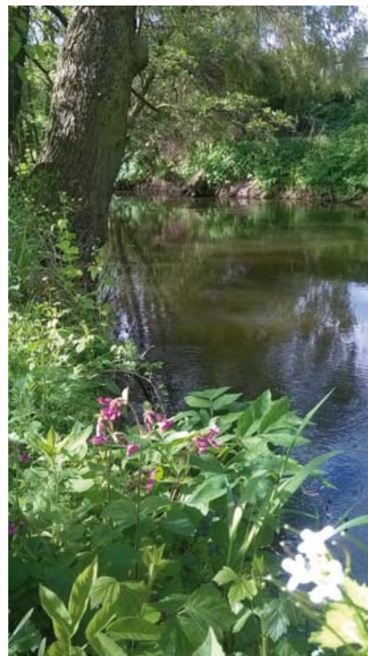
Opracowanie Janeczka Katarzyna i Wałdoch Weronika

Zrównoważony rozwój Powiatu Starogardzkiego może przynosić zyski płynące z ekorozwoju. Korzyści zależą między innymi od właściwej oceny planowanych inwestycji w zakresie gospodarki wodnej i wspierania przedsięwzięć najbardziej przyjaznych zasobom przyrodniczym regionu. Warto podkreślić, że to od nas wszystkich zależy jak będziemy chronić i inwestować w dobra naturalne tak, aby one przynosiły nam korzyści w przyszłości. Jak powiedział A. Kassenberg z Instytutu na rzecz Ekorozwoju „Jeżeli chcemy, żeby ten kraj sprawnie funkcjonował, muszą istnieć obszary, gdzie przyroda jest ważniejsza niż człowiek”.