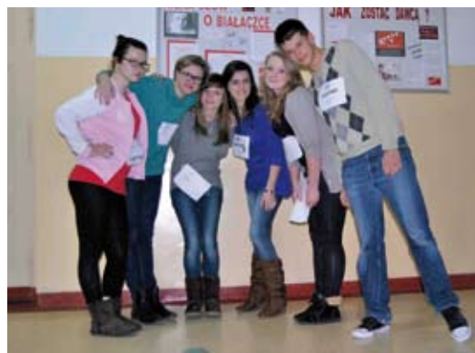
Starogardzka młodzież z grupy PaT.