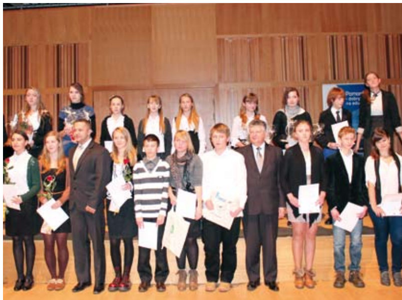
Nagrodzeni stypendyści Powiatu Starogardzkiego ze Starostą Starogardzkim i Wicewójtem Zblewa.

W dniu 3 grudnia 2012 r. w gmachu Polskiej Filharmonii Bałtyckiej im. Fryderyka Chopina w Gdańsku, odbyło się uroczyste wręczenie Stypendiów Marszałka Województwa Pomorskiego dla uczniów szczególnie uzdolnionych z przedmiotów matematyczno – przyrodniczych. Spośród 400 nagrodzonych w naszym woje-