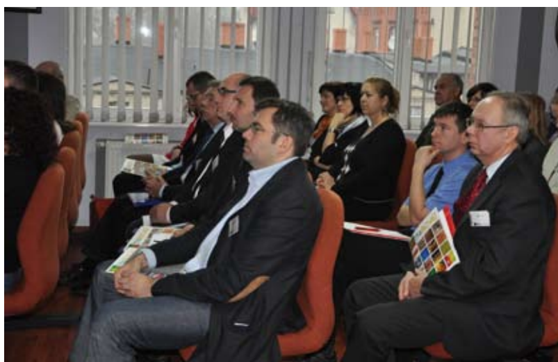
Uczestnicy debaty klimatycznej w Starostwie Powiatowym w Starogardzie Gdańskim.

Jak pokazują badania naukowe, zmiany klimatyczne i anomalia pogodowe spowodowane są zwiększeniem emisji dwutlenku węgla do atmosfery poprzez działalność człowieka i spalanie surowców naturalnych (węgiel i ropa naftowa). Duża emisja dwutlenku węgla wpływa niekorzystnie na jakość powietrza i stan środowiska naturalnego, a co za tym idzie, na warunki życia ludzkiego i zdrowie człowieka. Stąd niezwykle ważne staje się wspieranie działań zmierzających do redukcji CO 2 . Wychodząc naprzeciw tym potrzebom, Starogard Gdański przystąpił do projektu „Dobry klimat dla powiatów”, realizowanego przez Instytut na rzecz Ekorozwoju i Związek Powiatów Polskich.