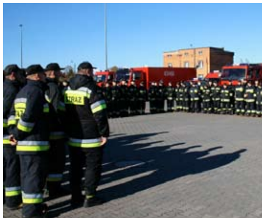
Strażacy przed rozpoczęciem ćwiczeń.

analiza i symulacja realizacji zewnętrznego planu operacyjno-ratowniczego w celu jego aktualizacji i dokonania w nim uzasadnionych zmian. Dzięki tym ćwiczeniom możemy doskonalić pracę ratowników w specjalistycznej grupie ratownictwa chemicznego, doskonalić umie-