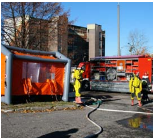
Ćwiczenia wymagały wykorzystania specjalistycznego sprzętu.

Ćwiczenia trwały ponad dwie godziny, co mogli odczuć zmotoryzowani mieszkańcy miasta, gdyż część dróg w pobliżu akcji została czasowo zamknięta dla ruchu publicznego.