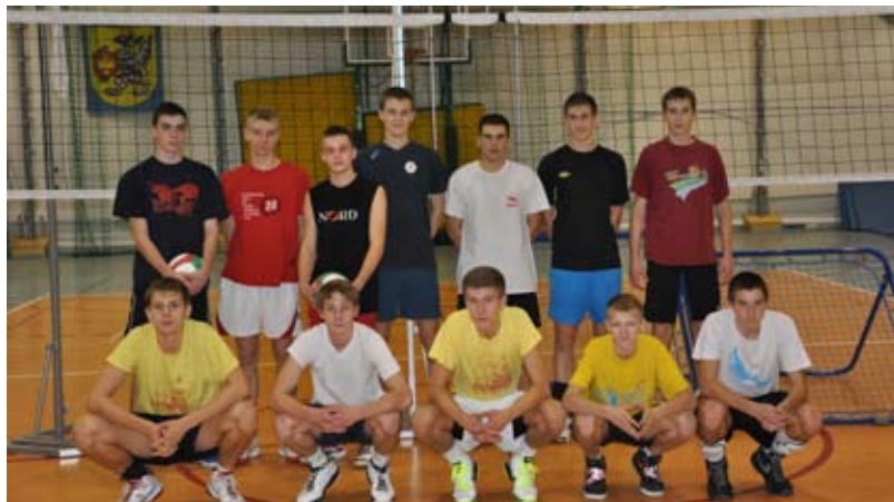
Kadeci sekcji siatkarskiej Starogardzkiego Klubu Sportowego.