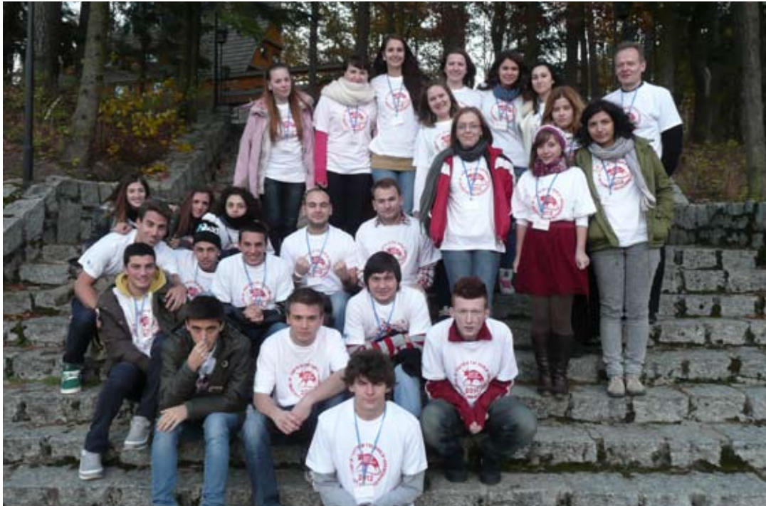
Uczestnicy międzynarodowej wymiany młodzieży z Włoch, Rumunii i Polski.

Jak powinna wyglądać wymiana pomiędzy młodzieżą z Włoch, Rumunii i Polski? W jaki sposób powinna zostać zorganizowana i jak powinna ona przebiegać. Na te pytania odpowie Młodzieżowa Rada Powiatu Starogardzkiego.