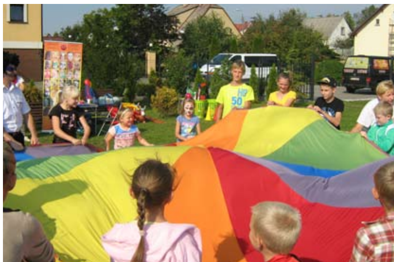
Uczestnicy pikniku podczas zabawy.