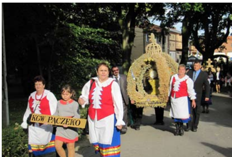
Tradycją dożynek jest korowód z wiencami dożynkowymi.

W kategorii „Zagroda” nagrody otrzymali: