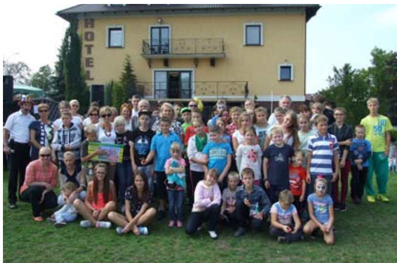
Piknik rodzinny w ramach projektu pn. „Edukacja i integracja przeciwko przemocy”.

Powiatowe Centrum Pomocy Rodzinie w Starogardzie Gdańskim informuje, że w ramach Programu Ośłonowego „Wspieranie Jednostek Samorządu Terytorialnego w Tworzeniu Systemu Przeciwdziałania Przemocy w Rodzinie” pozyskało dodatkowe środki z Ministerstwa Pracy i Polityki Społecznej. W związku z tym PCPR realizuje własny projekt pn. „Edukacja i integracja przeciwko przemocy”. Projekt realizowany jest w okresie od sierpnia do grudnia 2014 r. i skierowany jest do grupy 35 osób w wieku od 9 do 18 lat z terenu powiatu starogardzkiego. Celem programu jest rozwijanie umiejętności aktywnego spędzenia wolnego czasu, integracja z rówieśnikami, skorzystanie z grupowych i indywidualnych spotkań ze specjalistami oraz radzenie sobie ze stresem i prawidłowe reagowanie na agresję. Dla uczestników przygotowane są ciekawe i interesujące zajęcia, wśród których każdy znajdzie coś dla siebie. Są to: dwudniowe edukacyjno-integracyjne warsztaty wyjazdowe, zajęcia sportowe i