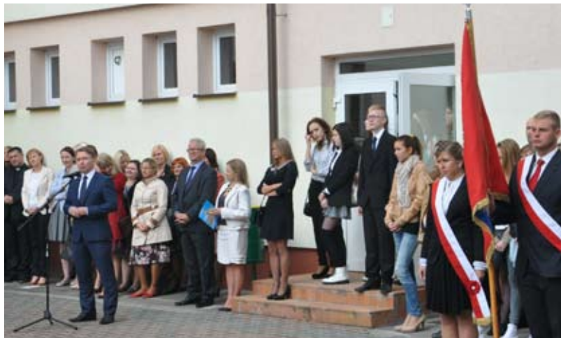
Rozpoczęcie roku szkolnego 2014/15 w II Liceum Ogólnokształcącym w Starogardzie Gdańskim.

Kolejne wakacje za nami, po dwóch miesiącach zasłużonego odpoczynku dzieci i młodzież wróciła w mury swoich szkół, aby podjąć dalszą na-