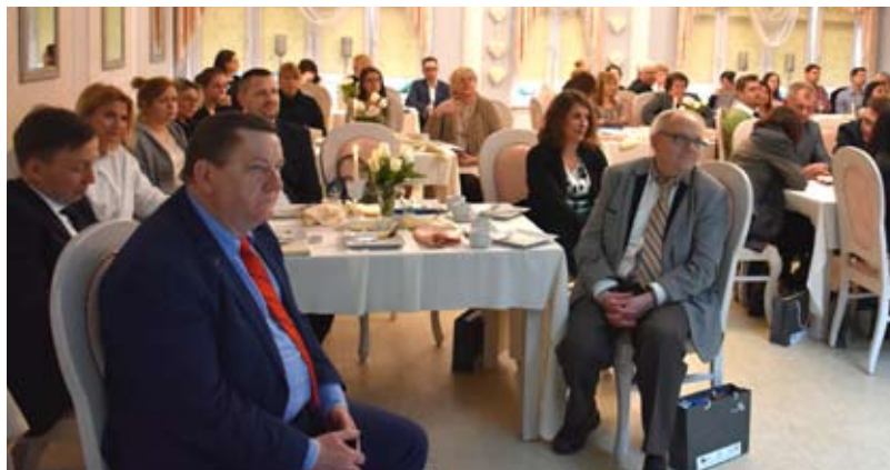
Śniadanie Biznesowe z Pomorską Agencją Rozwoju Regionalnego.

Za nami kolejny etap działań aktywizacyjnych dla osób bezrobotnych. Pomorska Agencja Rozwoju Regionalnego oraz Wojewódzki Urząd Pracy w Gdańsku zaprosili przedsiębiorców na spotkanie z cyklu „Śniadanie Biznesowe z Pomorską Agencją Rozwoju Regionalnego”.