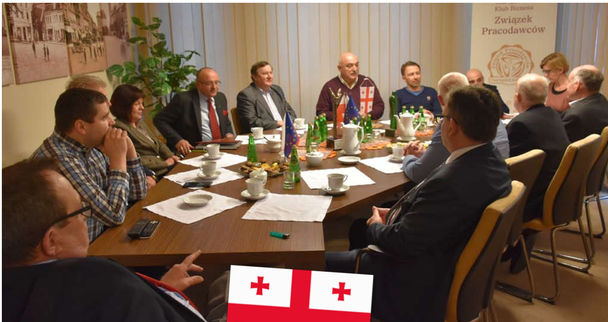
Delegacja wzięła udział w spotkaniu w siedzibie SKB-ZP.