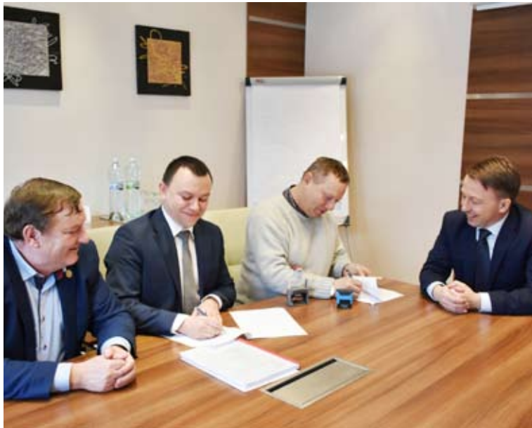
Podpisano umowę na wykonanie prac remontowych w szpitalu.

Zakres robót będzie dotyczył prac rozbiórkowych (w tym m. in.: rozbiórka istniejącego zadaszenia, schodów zewnętrznych, ściany balustradowej, płytek chodnikowych, demontaż balustrad, witryn), prac projektowanych (w tym m.in.: wykonanie schodów zewnętrznych, poziomych okładzin schodów zewnętrznych i pochylni z płyt kamiennych, tynków ścian bocznych schodów i pochylni dla niepełnosprawnych, warstw dachu nad wiatrołapem, wymurowanie