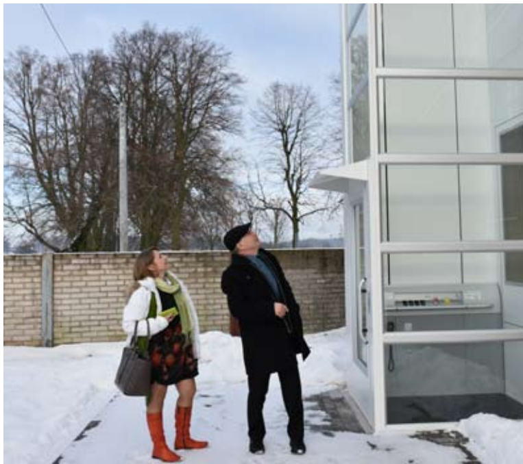
Nowoczesna platforma ma służyć osobom niepełnosprawnym.

- Uczniowie, którzy mają zajęcia w budynku głównym szkoły, będą mogli poruszać się pomiędzy piętrami. Uczniowie, którzy mają problemy z poruszaniem, a poprzez chorobę zmuszeni są do codziennego korzystania z gabinetu medycznego, znajdującego się na I piętrze, również użytkować będą windę. Wszystkie osoby z „chwilową” niepełnosprawnością jak np. z nogą w gipsie skorzystają z tej dogodności. Pozostali uczniowie będą mogli eksploatować urządzenie tylko w przypadku świadczenia pomocy osobie niepełnosprawnej za zgodą nauczyciela