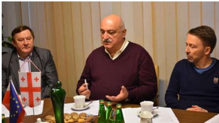
Mer Gori zaprosił na forum gospodarcze.