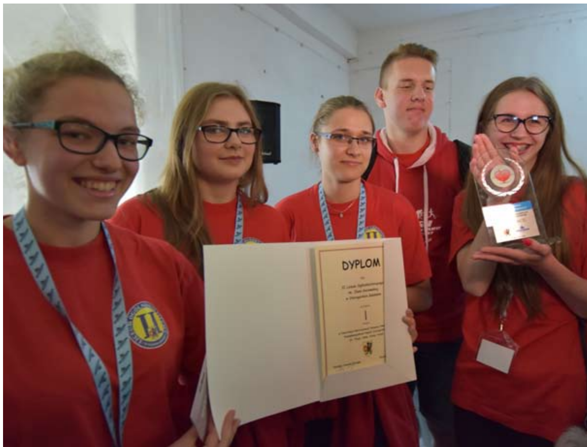
Dla najlepszych były dyplomy i nagrody.

Wszystkim drużynom i ich opiekunom serdecznie gratulujemy!