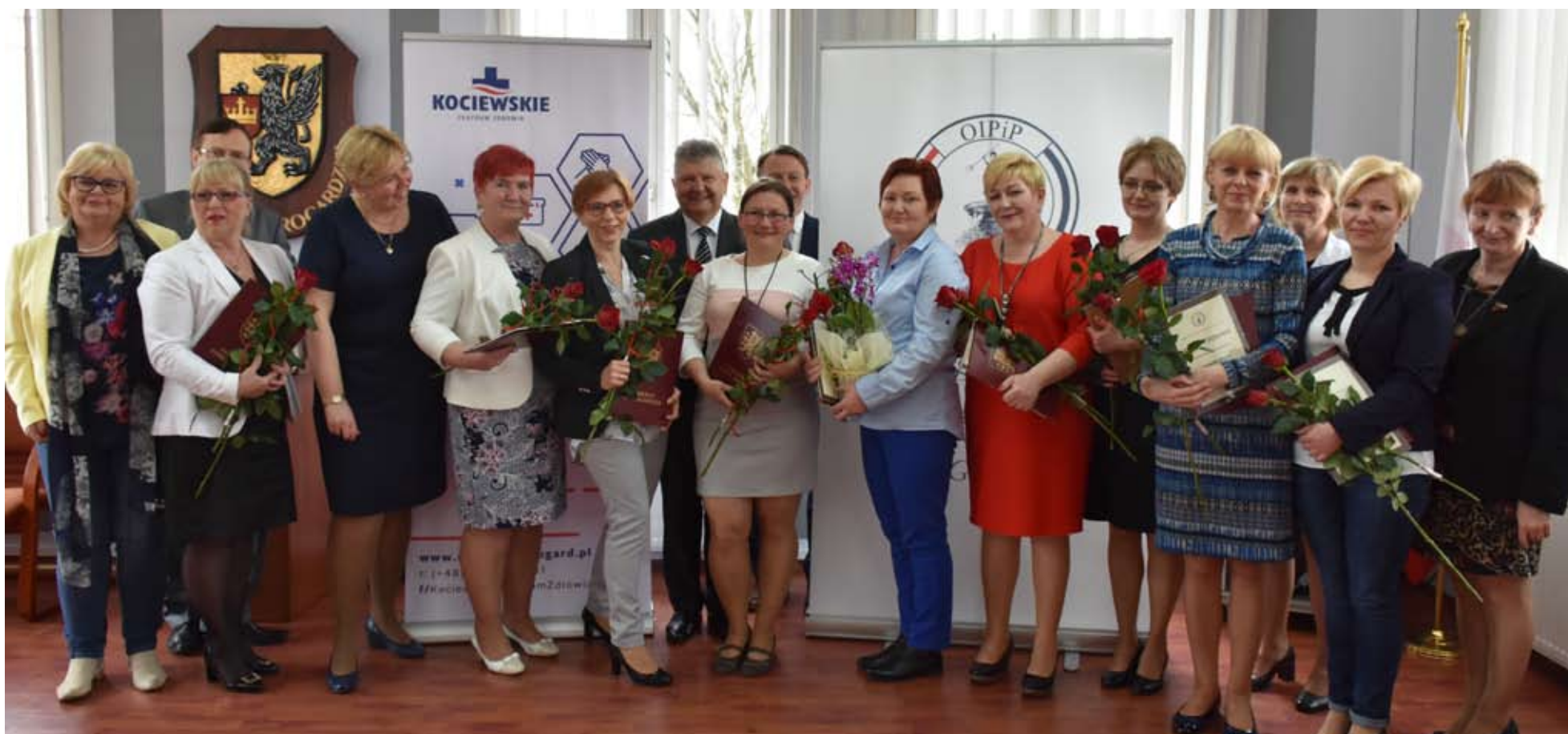
Pielęgniarkom i położnym wręczone zostały dyplomy i listy gratulacyjne za wzorową pracę.

Doskonale wiedzą, jak źle człowiek może się czuć, gdy trzeba walczyć z chorobą. Potrafią pomóc w cierpieniu, wesprzeć dobrym słowem, czy choćby ciepłym uśmiechem. Starają się znaleźć chwilę, by ta druga osoba nie była osamotniona. O kim mowa? O pielęgniarkach i położnych, które obchodziły swoje doroczne święto.