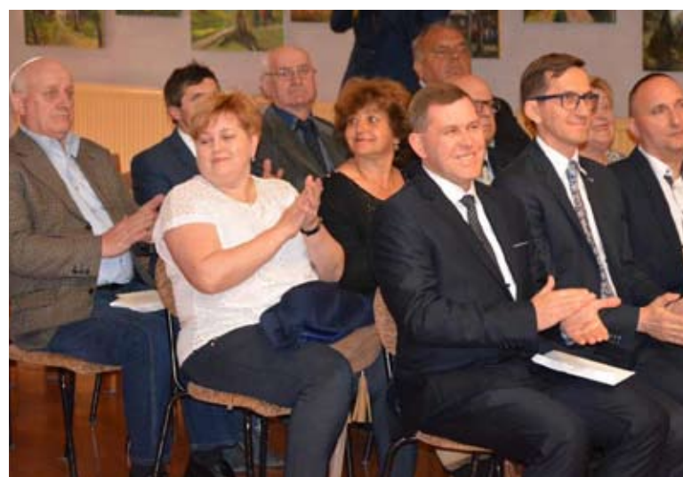
Sesja w Skórczu odbyła się w 83. rocznicę nadania praw miejskich.