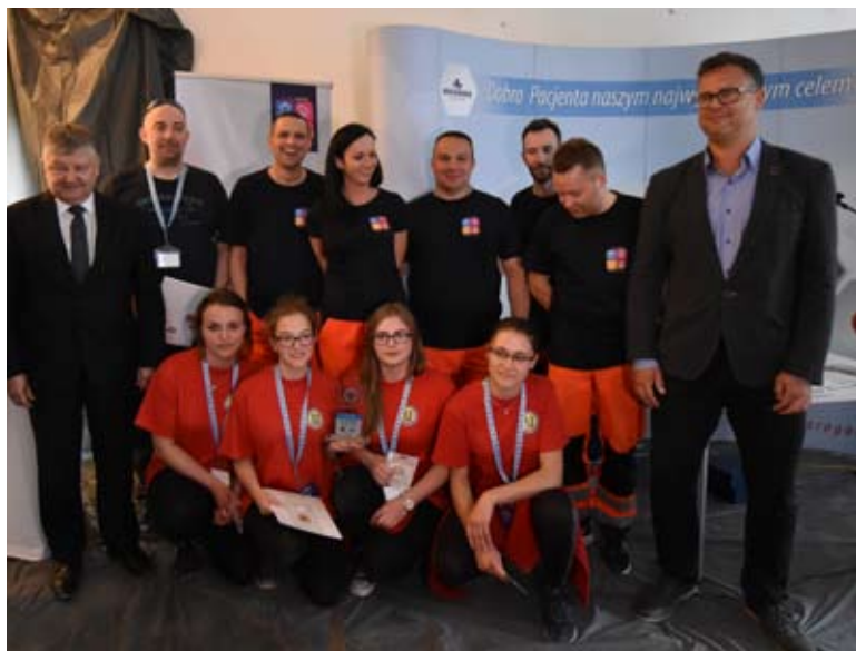
Zwycięska ekipa z II LO.