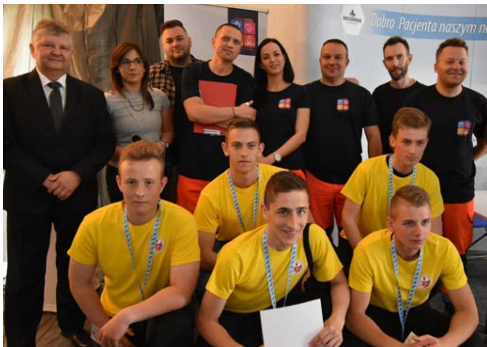
Na IV miejscu znalazła się drużyna „ekonomika”.