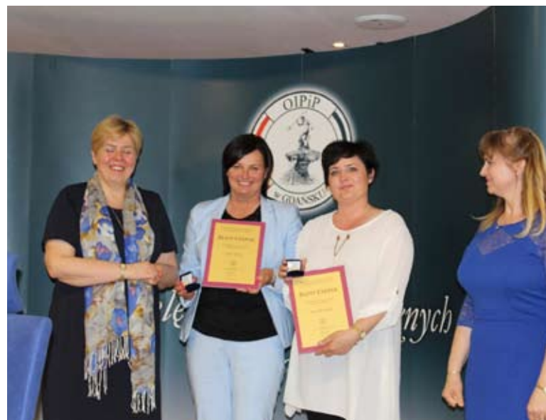
Pielęgniarki z Domu Pomocy Społecznej w Szpęgawsku otrzymały nagrody w Urzędzie Marszałkowskim.

W tym roku tę prestiżową nagrodę otrzymały trzy panie. W