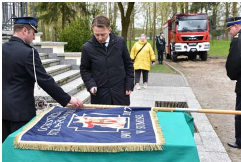
Strażacy z Sumina obchodzili jubileusz 110-lecia istnienia, co uhonorowali sztandarem.