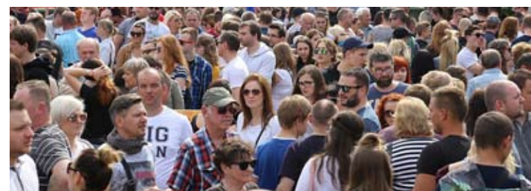
Piknik odwiedziło około 50 tysięcy osób.

i jego walory przyrodnicze, turystyczne i kulturowe. Wśród nich znajduje się również „Piknik nad Odrą”, który z roku na rok zdobywa coraz więcej wystawców. Dlatego też wśród ponad 300 wystawców nie mogło zabraknąć stoiska Powiatu Starogardzkiego. Tegoroczne Targi Turystyczne Piknik nad Odrą należały do bardzo udanych, o czym świadczy ogromne zainteresowanie wystawców i turystów. Według szacunków organizatorów udział w Pikniku wzięło ponad 300 wystawców i około 50 tysięcy odwiedzających.