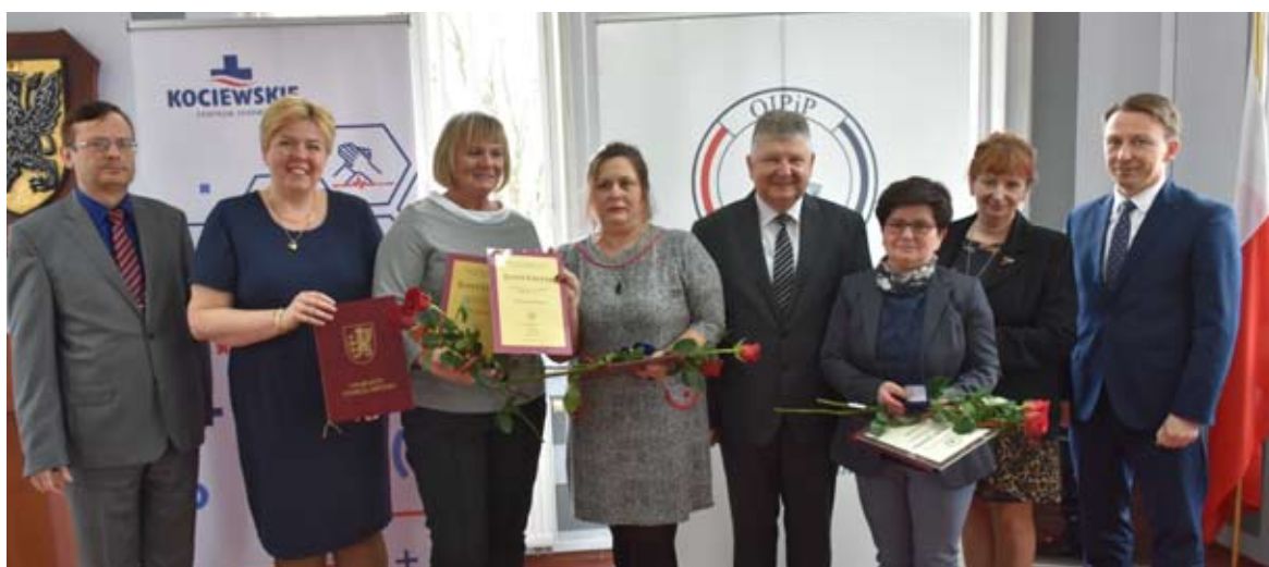
Podczas uroczystości trzy panie otrzymały nagrody „Złoty Czepek”.