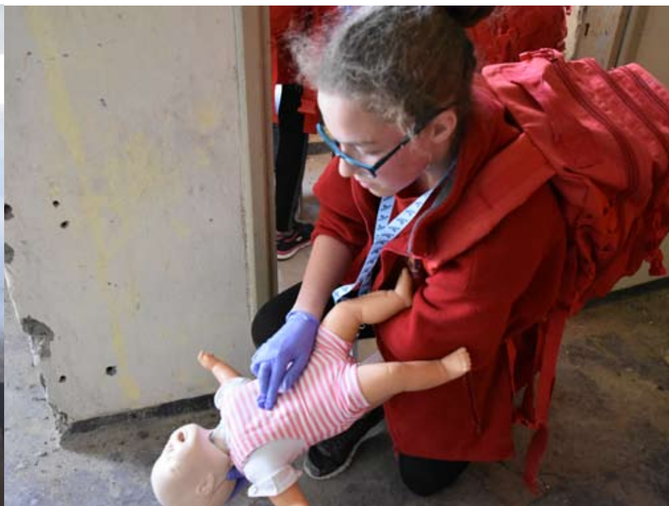
Czasami trzeba było pomagać najmłodszym.