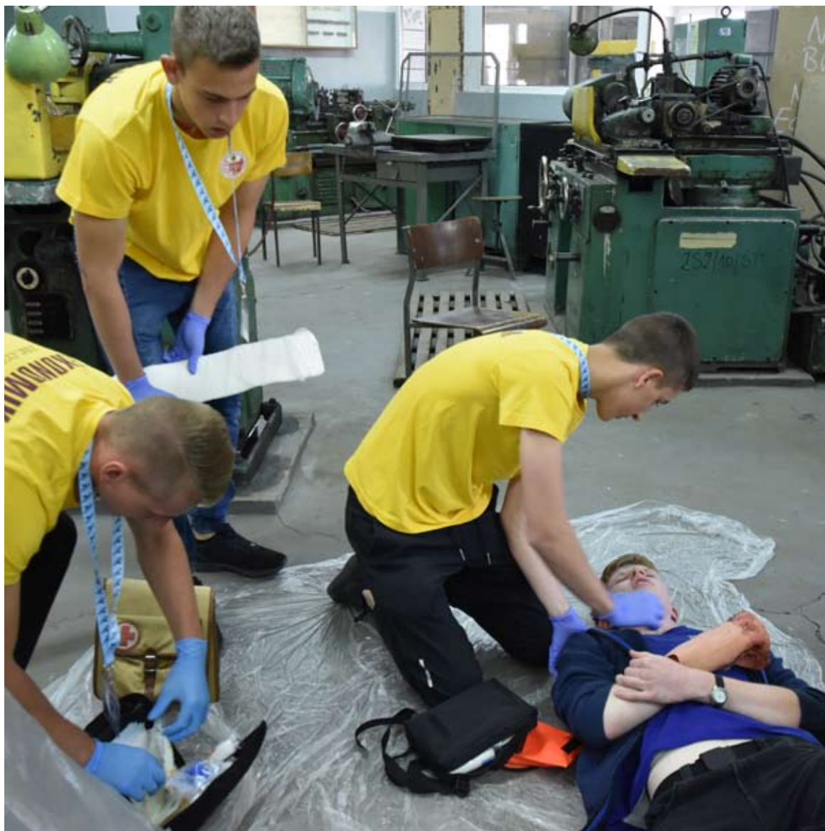
Rywalizacja polegała na fachowej pomocy poszkodowanym.