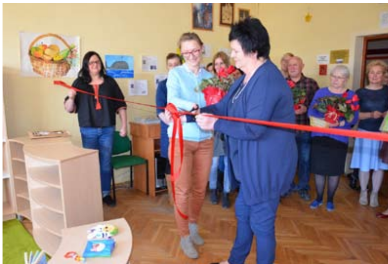
W szkole została otwarta nowa wypożyczalnia książek.