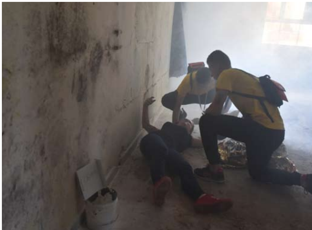
Uczniowie musieli się zmagać z różnymi sytuacjami.