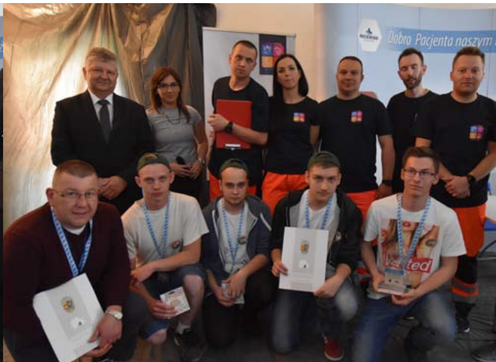
Trzecie miejsce wywalczył Zespół Szkół Zawodowych.