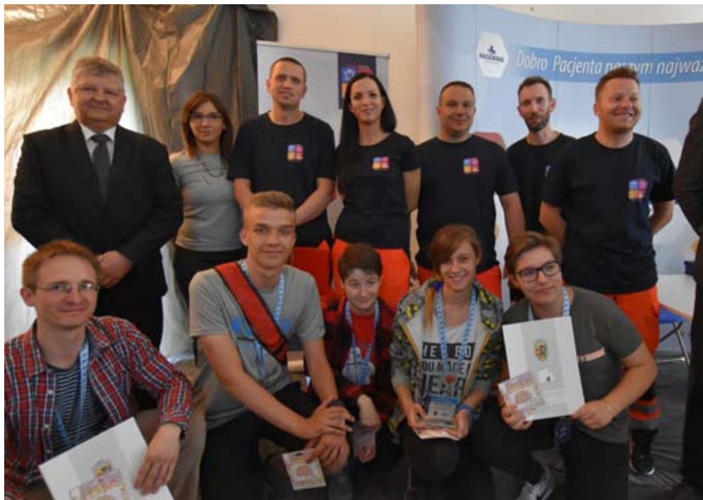
Na drugim miejscu uplasowała się drużyna z LO.