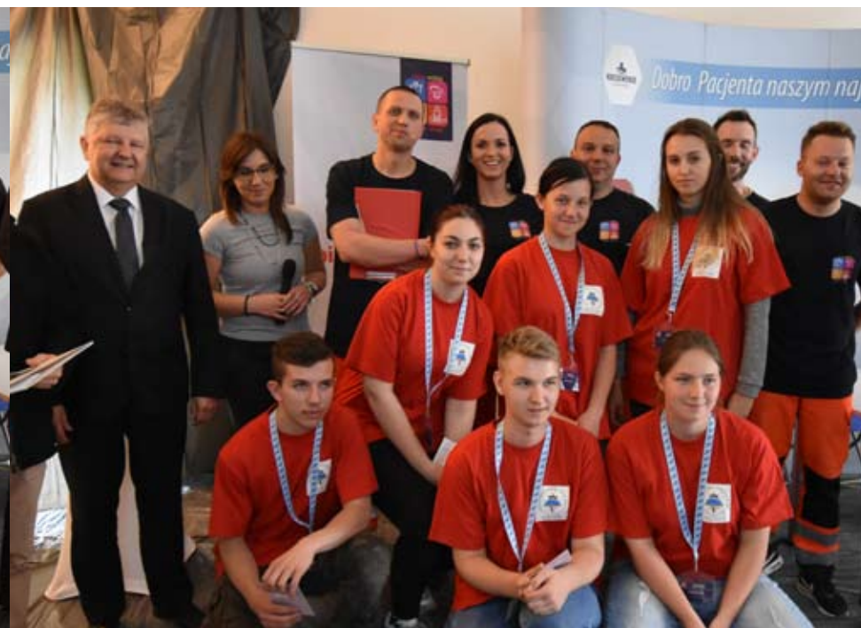
Piąte miejsce należało do Zespołu Szkół Rolniczych CKP w Bolesławowie.