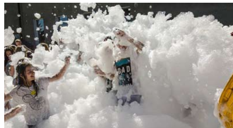
Podczas pikniku w Osieku nie brakowało atrakcji dla najmłodszych.