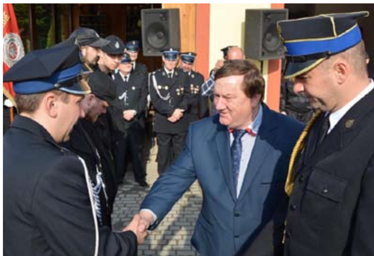
W Pączewie odbyły się gminne obchody Dnia Strażaka.

chód gaśniczy marki MAN TGM 18 340. Przedsięwzięcie połączone z gminnymi obchodami Dniami Strażaka, na których odznaczono i wyróżniono druhow. W uroczystości uczestniczyli m.in. wicestarosta starogardzki