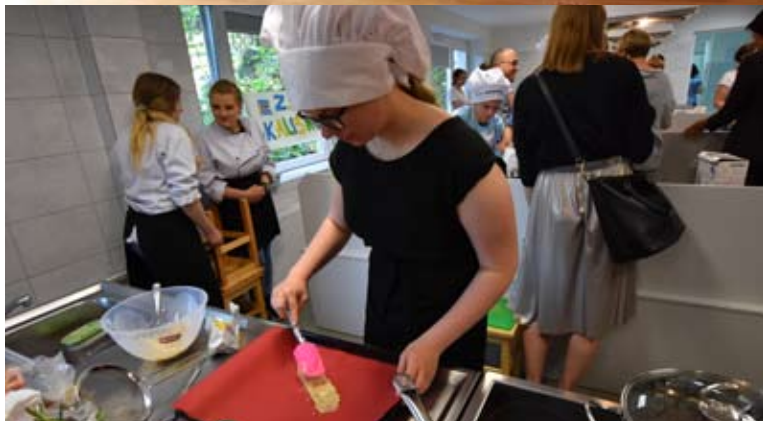
W szkole została otwarta nowa wypożyczalnia książek.