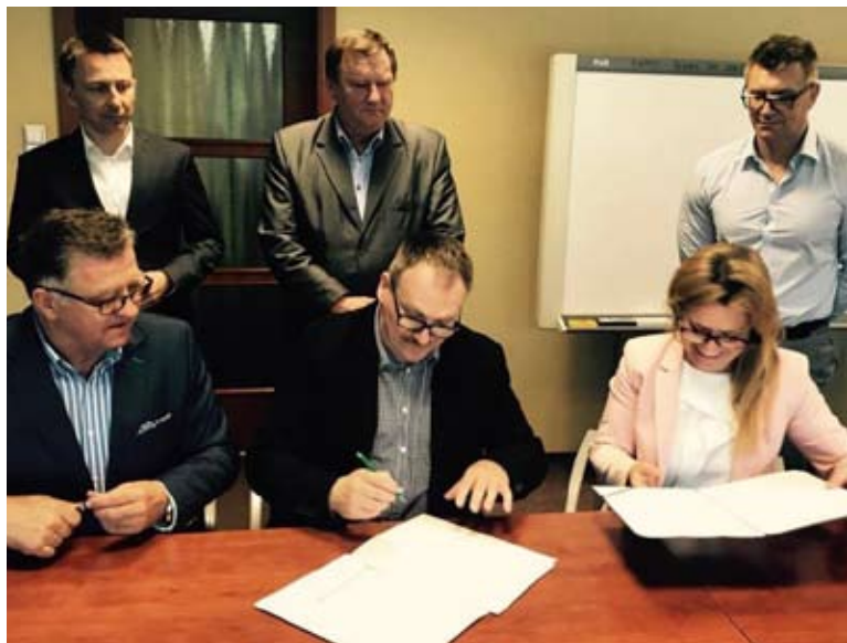
W siedzibie Igloteksu została podpisana umowa o współpracy.

W Skórczu została podpisana umowa pomiędzy firmą Iglotex a Zespołem Szkół Ponadgimnazjalnych im. Włodzimierza Mykietyna. Dotyczy ona głównie ścisłej współpracy i utworzenia w placówce klas patronackich. Mają się z nich kształcić przyszli pracownicy Igloteksu.