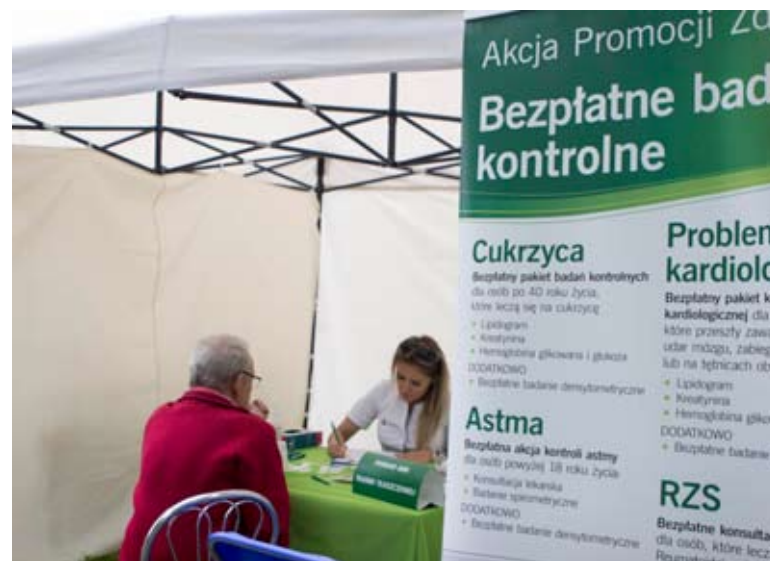
Wiele osób skorzystało z bezpłatnych badań.

teuty i masażysty, masaże oraz zabiegi, tj.: laser, ultradźwięki i prądy). Dodatkowo na wszystkich zainteresowanych czekało stanowisko z Pudełkami Życia i Kartą ICE. Pudełko Życia to ak-