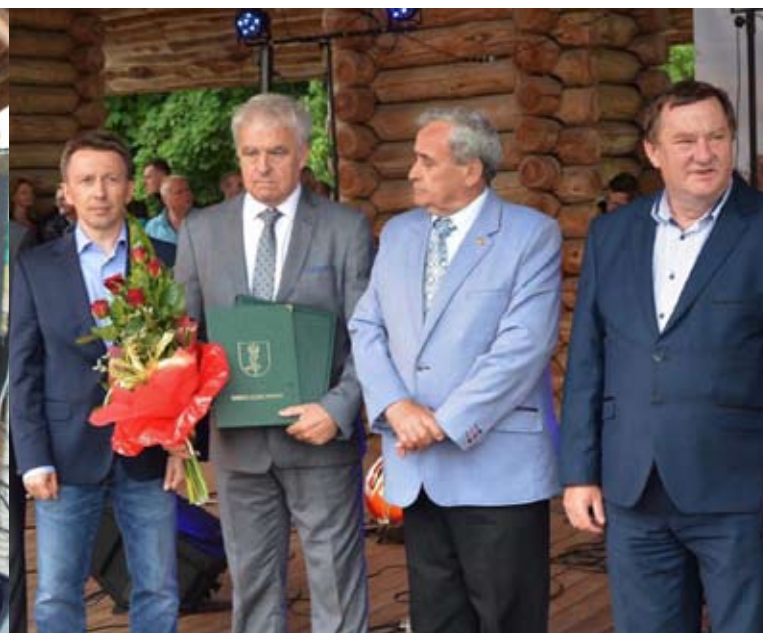
Życzenia złożyły władze powiatu.