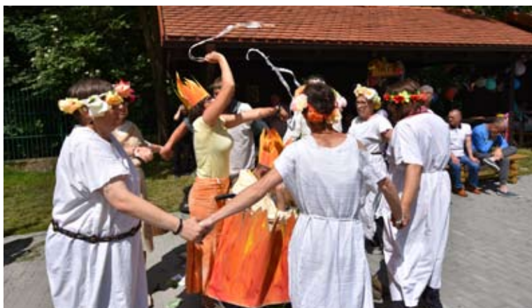
Była okazja do zabawy...

Dzięki dofinansowaniu na projekt „Razem przeciw wykluczeniu”, które udzielił Powiat Starogardzki, na terenie DPS Szpęgawsk została zorganizowana impreza plenerowa pod nazwą „Wiła wianki”. Uczestnikami zabawy byli mieszkańcy powiatu starogardzkiego oraz zaproszeni goście z Domów Pomocy Społecznej oraz Środowiskowych Domów Samopomocy. To już kolejny rok, w którym Stowarzyszenie „Cordis” zorganizowało imprezę plenerową.