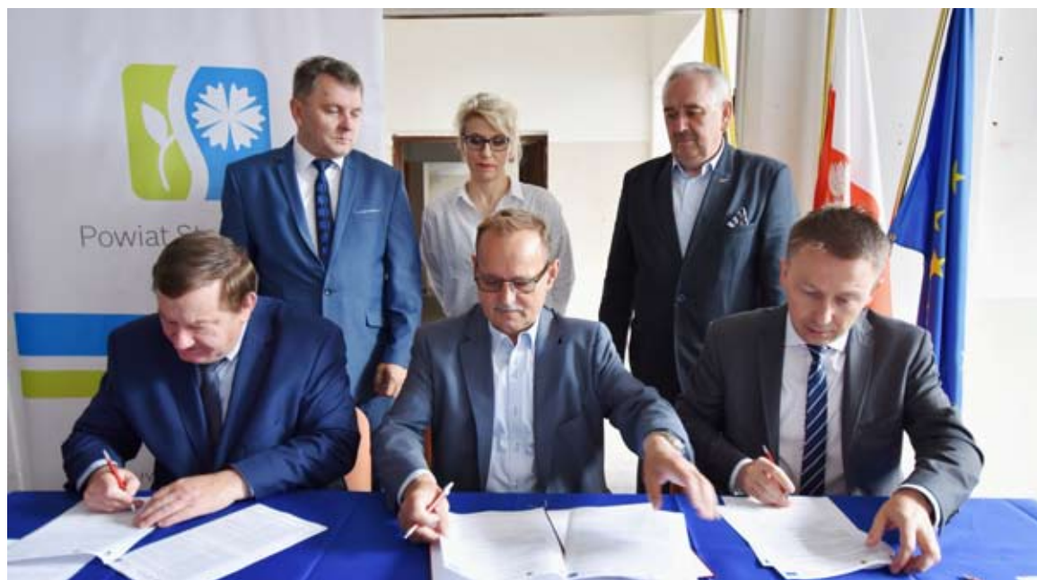
Podpisane zostały umowy z wykonawcami inwestycji.

Powiat Starogardzki konsekwentnie realizuje inwestycje infrastrukturalne oraz edukacyjne. Tym razem utworzy dwa centra kształcenia ustawicznego i praktycznego.