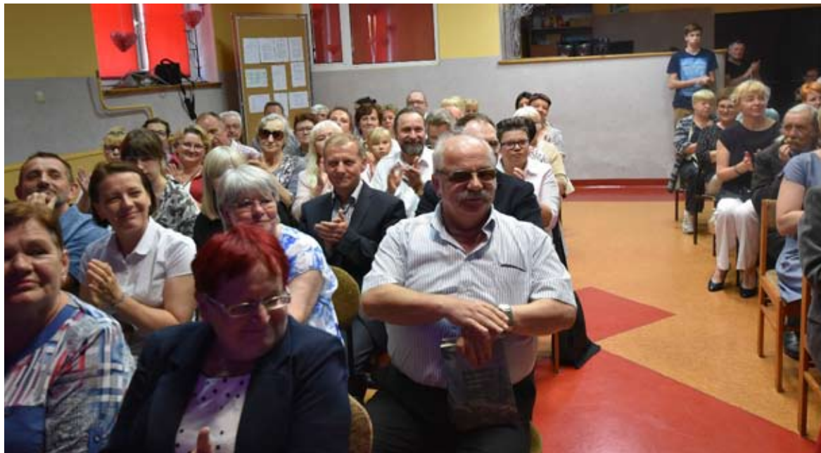
Sala Miejskiego Ośrodka Kultury była pełna po brzegi.