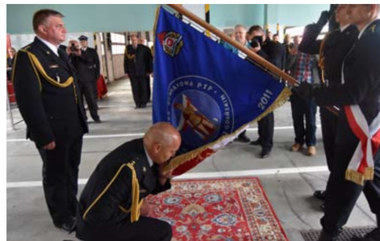
Nowy komendant złożył ślubowanie.