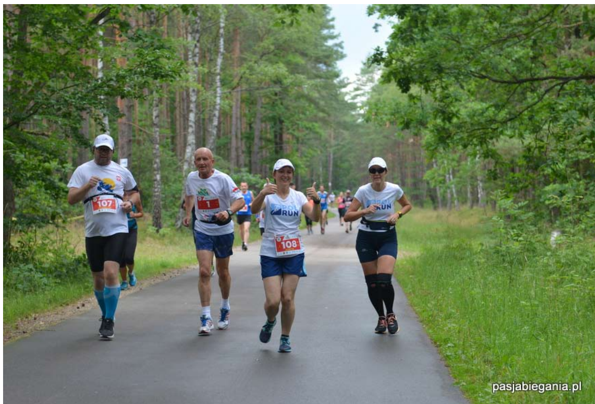
Podczas biegów wszystkim humory dopisywały.

Tegoroczny Jubileuszowy 10 Bieg Czterech Jezior Skórcz organizowany przez Stowarzyszenie Aktywni Kociewiaczy ze Skórcza oraz władze Miasta Skórcz przeszedł do historii w całkowicie nowej formule. Do dotychczasowych organizatorów dołączył Team MX Skórcz, który przygotował wyścig rowerowy MTB na dystansie 27 km.