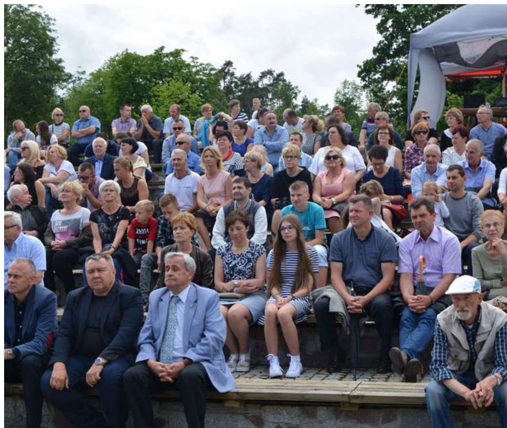
W uroczystości wzięło udział wielu zaproszonych gości.