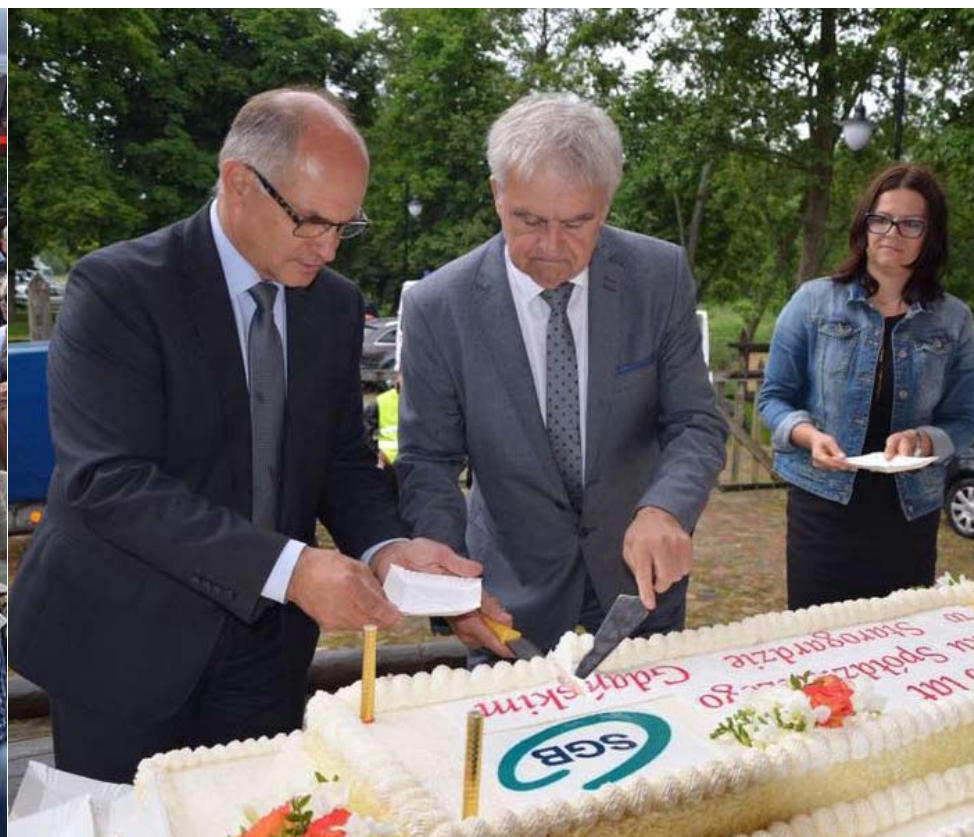
Jubileusz bez tortu? Niemożliwe!