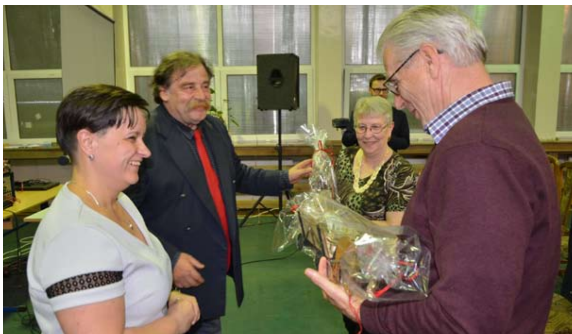
Dyrekcja szkoły podziękowała zagranicznym gościom.