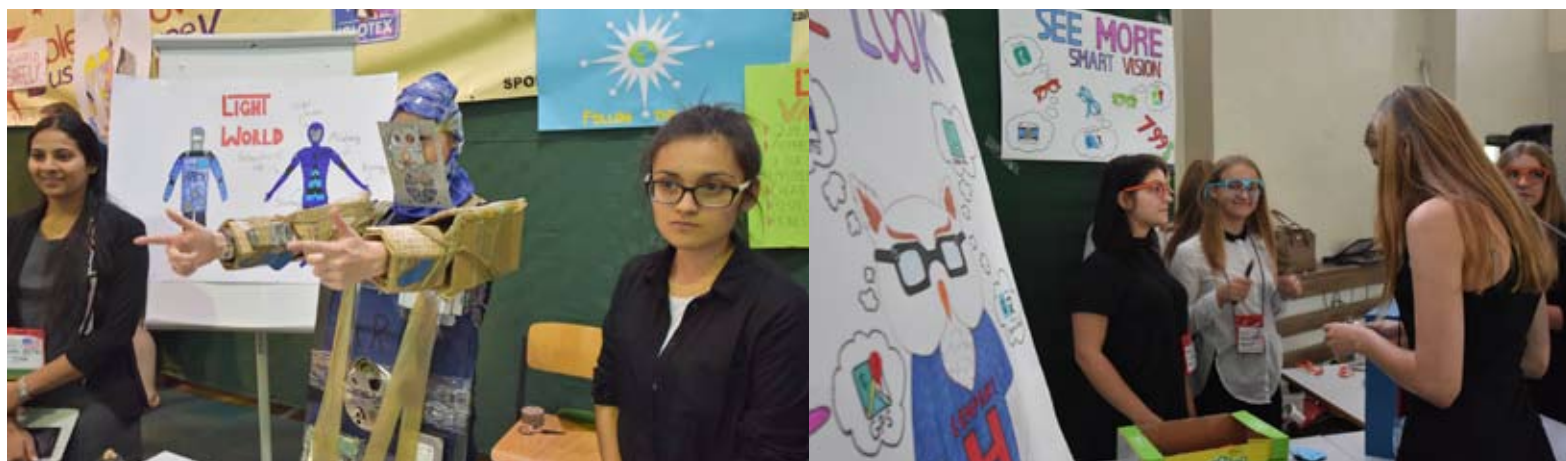
Młodzież próbowała swoich sił w prowadzeniu biznesu.