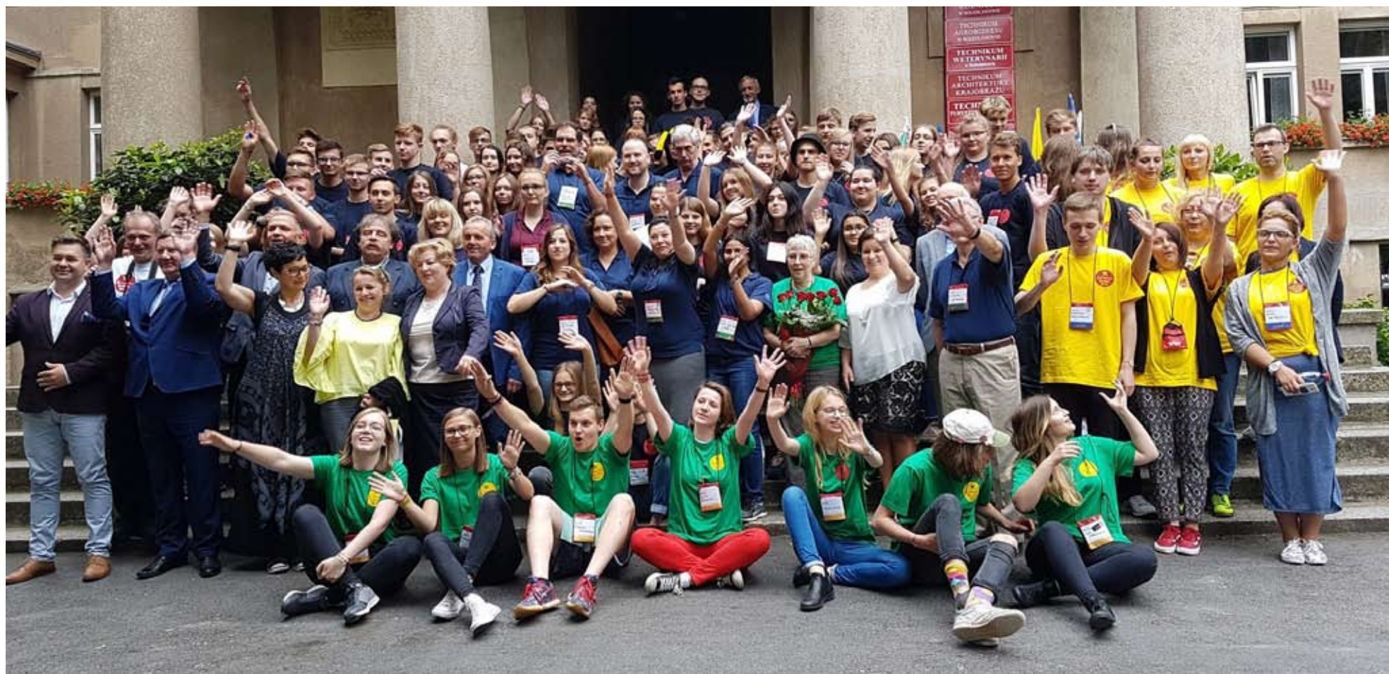
Pamiątkowe zdjęcie uczestników Bolesławowo Business Week wraz z przedstawicielami samorządu.

Siódma edycja Bolesławowo Business Week za nami. Uczestnicy warsztatów prowadzonych przez naszych Przyjaciół ze Stanów Zjednoczonych ze łzami w oczach żegnali się z kolegami i nauczycielami. Nie bez powodu.