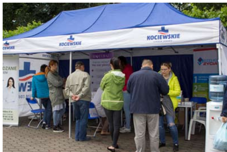
Frekwencja podczas Parku Zdrowia była spora.

Podczas zorganizowanego przez Kociewskie Centrum Zdrowia wspólnie z Polpharmą „Parku Zdrowia” pacjenci mieli możliwość skorzystania z szerokiego wachlarza bezpłatnych badań profilak-