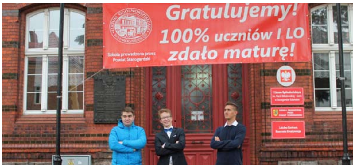
Uczniowie I LO zdali maturę w 100 procentach!

Znane są wyniki matur na Pomorzu. Rewelacyjny poziom zdawalności osiągnęli uczniowie szkół ponadgimnazjalnych prowadzonych przez Powiat Starogardzki. Nasi maturzyści zajęli 2 miejsce w województwie. Serdecznie gratulujemy!