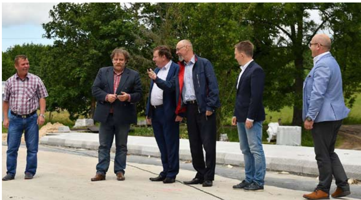
Władze powiatu przyglądały się inwestycjom prowadzonym na drogach.

Zachęcamy Was do zapoznania się ze szczegółowym wykazem dotyczącym remontów dróg w tym oraz w przyszłym roku. Jest on dostępny na stronie: http://bit.ly/2uHr8ec