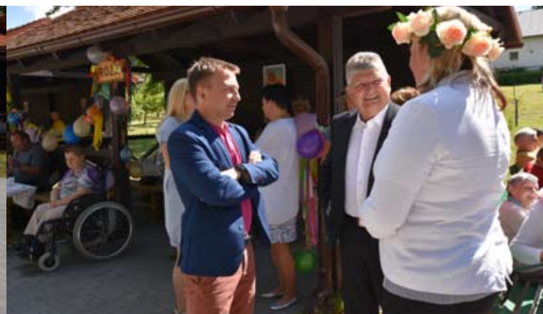
... oraz do wymiany zdań.