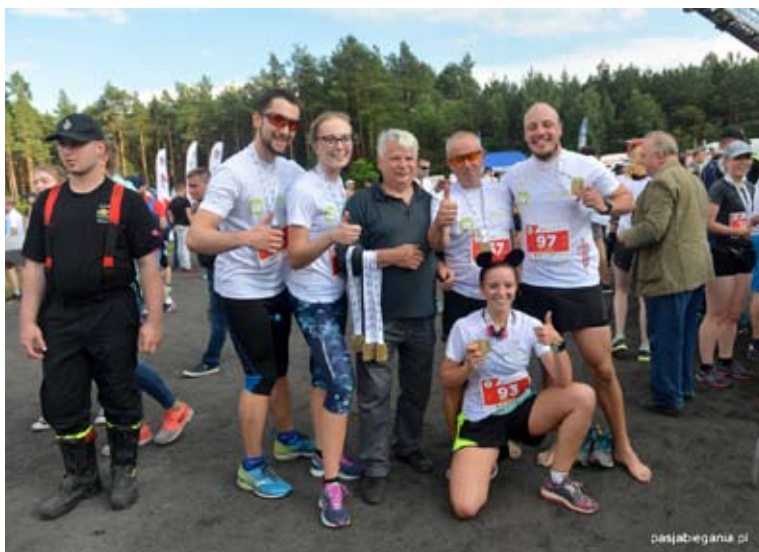
Gościem specjalnym był Marszałek Senatu Bogdan Borusewicz.

uczestników poszczególnych dyscyplin było ponad 800 i kilka-