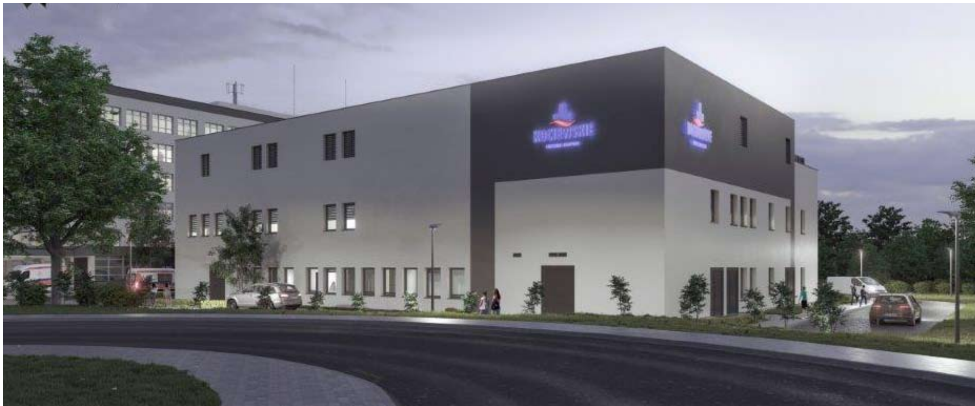
Tak przedstawia się wizualizacja bloku operacyjnego.

Powiat Starogardzki pozyskał blisko na 21 milionów złotych z Regionalnego Programu Operacyjnego Województwa Pomorskiego na lata 2014-2020.