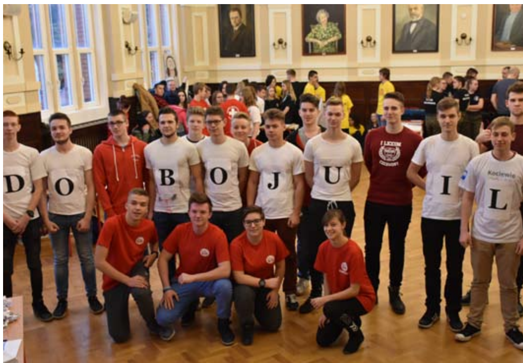
Najlepsza okazała się drużyna z I LO.