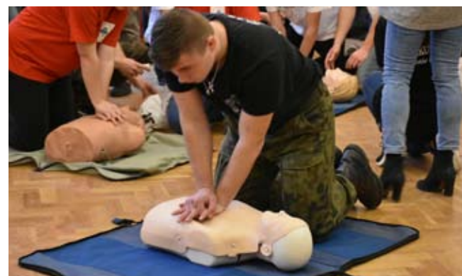
Finałowym momentem było uciskanie klatki piersiowej w rytm piosenki zespołu Bee Gees.