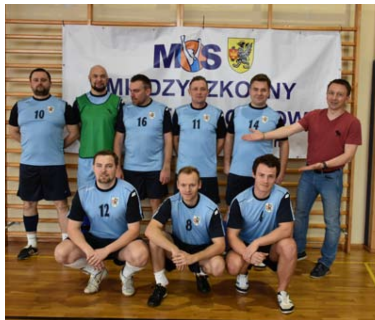
Reprezentacja Powiatu Starogardzkiego była najlepsza... w swojej kategorii wiekowej.