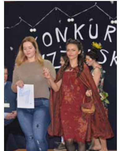
Efekty pracy można było podziwiać podczas pokazu.

Tematem przewodnim dla klas: pierwszej i drugiej były postacie z bajek, natomiast zawodniczki z klasy trzeciej przygotowały stylizacje sylwestrowe. Uczennice miały dwie godziny na przygotowanie fryzur, a efekty ich pracy mogliśmy podziwiać podczas pokazu na holu szkoły. Publiczność głośno wyrażała swój zachwyt i dopingowała modelki prezentujące się na scenie. Jury