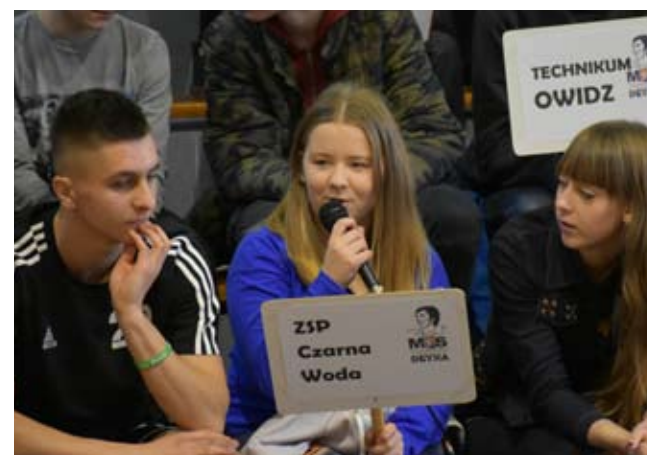
Młodzież zmagala się z pytaniami dotyczącymi legendarnego piłkarza.