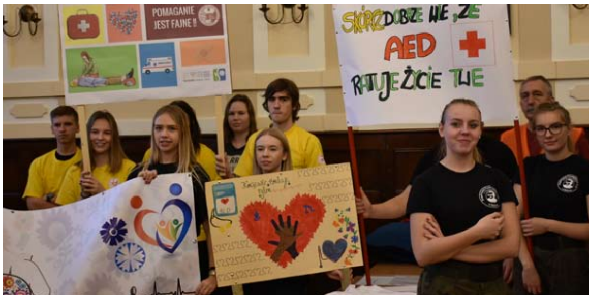
Każda ze szkół przygotowała strefę kibica, która mocno dopingowała drużyny.

Nagle zatrzymanie krążenia (NZK) dotyka w Polsce ok. 40 tys. osób rocznie. Z tej liczby udaje się uratować zaledwie 2-5% pacjentów. Dlaczego tak mało? Ponieważ podstawowym czynnikiem warunkującym przeżycie jest szybkość działania. Gdy serce przestaje funkcjonować prawidłowo, natleniona krew nie dociera do mózgu. Poszkodowany nagle traci przytomność i przestaje oddychać. Niedotlenione komórki centralnego ośrodku nerwowego zaczynają obumierać po zaledwie 4 minutach! Wiedzą o tym doskonale uczestnicy wydarzenia pn. Bicie Rekordu w Uciskaniu Klatki Piersiowej, który w auli I Liceum Ogólnokształcącego spróbowali swoich sił w niełatwych zmaganiach. Trzeba było nie tylko poprawnie odpowiedzieć na pytania przygotowane przez ratowników me-