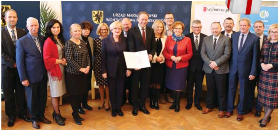
Marszałek oraz prezydenci i starostowie z całego Pomorza podpisali list intencyjny.

W siedzibie Centrum Edukacji Nauczycieli w Gdańsku odbyła się debata organizowana przez Gazetę Wyborczą we współpracy z Urzędem Marszałkowskim Województwa Pomorskiego, dotycząca szkolnictwa zawodowego na Pomorzu – m.in. wzmocnienia prestiżu kształcenia zawodowego, promocji szkół zawodowych oraz współpracy tych szkół z pracodawcami. Władze powiatu starogardzkiego podpisały list intencyjny.