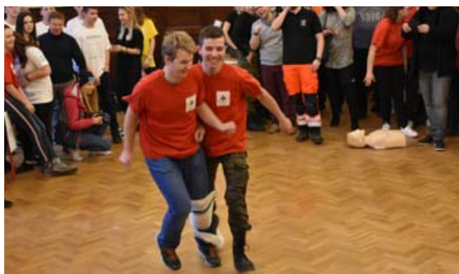
Zadanie nie było łatwe, a jeszcze do tego trzeba było działać pod presją czasu.