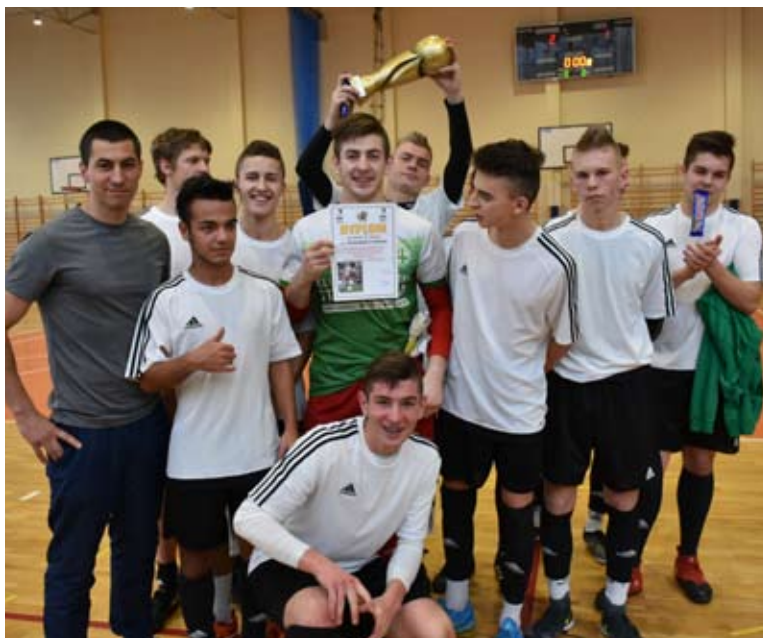
Najlepsza okazała się ekipa z Technikum w Owidzu.

Podczas turnieju rozstrzygnięto również konkurs plastyczny. Najlepiej Kazimierza Deynę przed-