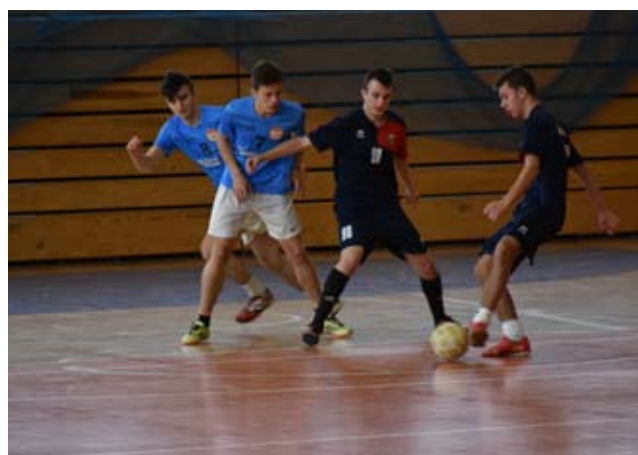
Każdy zespół grał najlepiej jak potrafi.