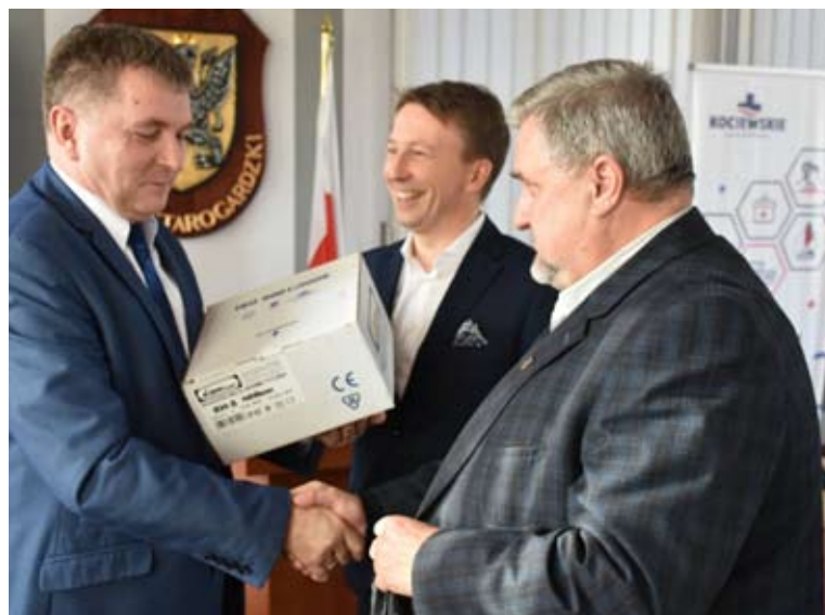
Każda ze szkół prowadzonych przez samorząd powiatowy otrzymała urządzenie.