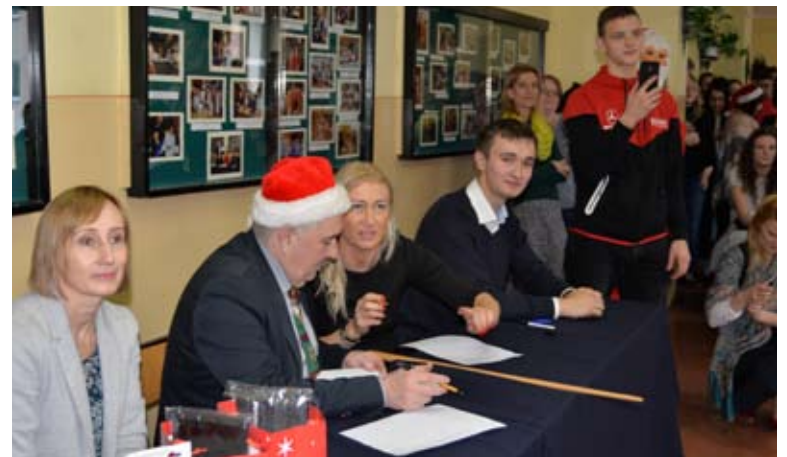
Jury miało twardy orzech do zgryzienia.