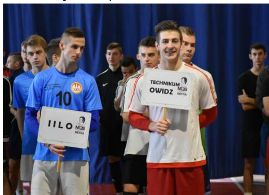
W rywalizacji wzięły udział reprezentacje szkół oraz Powiatu Starogardzkiego.