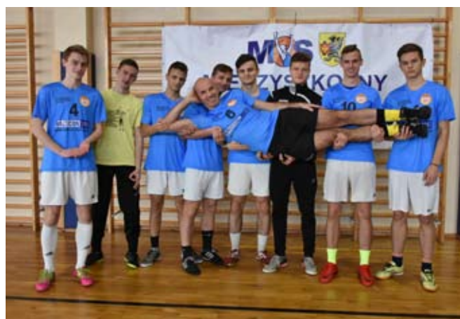
Humory wszystkim dopisywały.