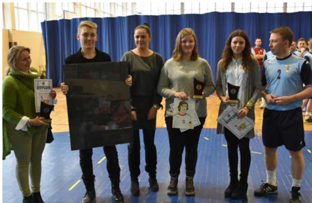
Podczas turnieju nagrodzono laureatów konkursu plastycznego.