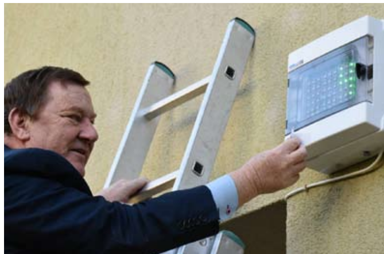
Na budynkach szkół montowane są specjalne urządzenia do pomiaru pyłu.

zostały specjalne urządzenia do pomiaru pyłu zawieszonego PM10 i PM2,5 z jednoczesnym pomiarem temperatury, wilgotności powietrza oraz ciśnienia. Uczniowie walczą ze smogiem, ale także o główną nagrodę, czyli wycieczkę dla zwycięskiego zespołu badawczego, który najlepiej opracuje wyniki oraz przygotuje ich interpretację i przedstawi sposoby walki ze