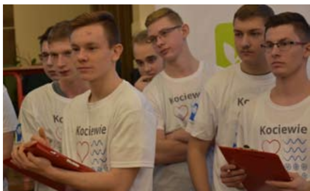
Jednym z elementów zmagañ był test wiedzy.

Z dziennikarskiego obowiązku podamy tylko, że I miejsce wywalczyło I LO, II miejsce Zespół Szkół Zawodowych, III miejsce Zespół Szkół Ponadgimnazjalnych w Skórczu, IV miejsce Zespół Szkół Ekonomicznych, V miejsce - Zespół Szkół Rolniczych Centrum Kształcenia Praktycznego w Bolesławowie, VI miejsce - II Liceum Ogólnokształcące, VII - Zespół Szkół Ponadgimnazjalnych w Czarnej Wodzie.