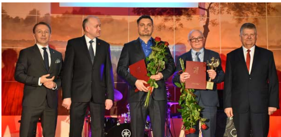
W dziedzinie gospodarki „Kociewskie Gryfy” zostały przyznane firmom Izol-Dach oraz Graso.