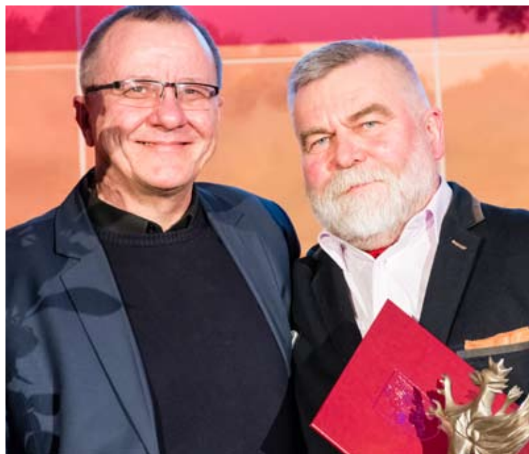
Imprezą Roku wybrano Noc Bardów.