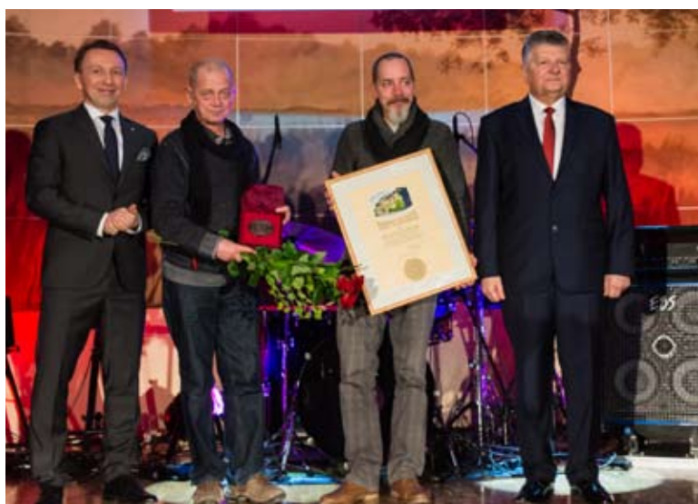
Nagrodę Specjalną otrzymał Teatr „Kuźnia Bracka”.

Drugą nagrodę specjalną otrzymał Zespół regionalny „Lubichowskie Kociewiaki” za 25-letnią działalność promującą Kociewie, a w szczególności za kultywowanie i przekazywanie młodym pokoleniom historii dawnych obyczajów, tańców, gadek i przyspiewek naszego regionu. - To właśnie w progach Gminnego Ośrodka Kultury swoją działalność rozpoczął zespół Lubichowskie Kociewiaki -