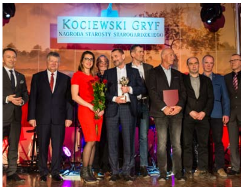
Za najlepszą imprezę sportową uznano Bieg Czterech Jezior w Skórczu.