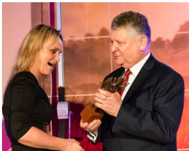
Organizacją Pozarządową Roku wybrano Stowarzyszenie rodziców wychowujących dzieci niepełnosprawne „Dziecko miłości”