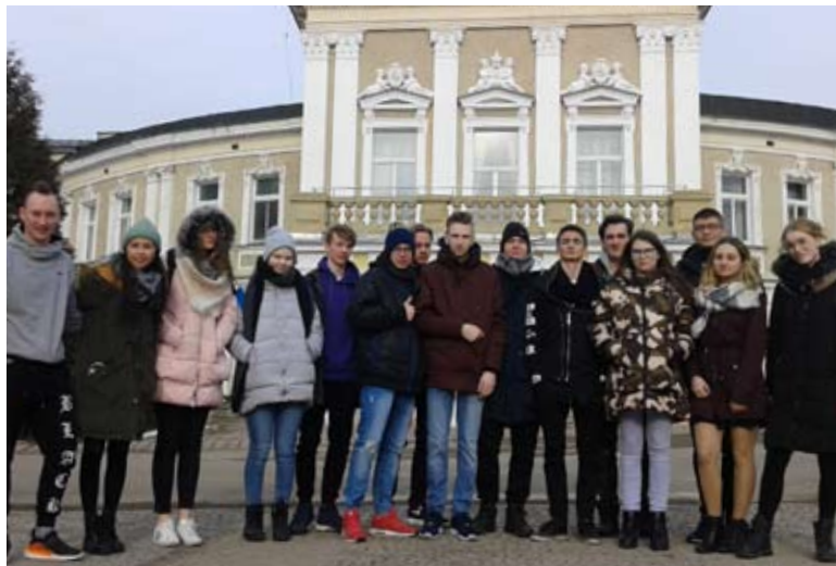
Spotkanie to odbyło się w malowniczej miejscowości, jaką jest Łądek Zdrój.

kich jak m.in.: pisanie CV i listu motywacyjnego, prowadzenie negocjacji w języku obcym czy autoprezentacja. Wszystkie zajęcia prowadzone były w języku angielskim przez wolontariuszy pochodzących z bardzo odle-