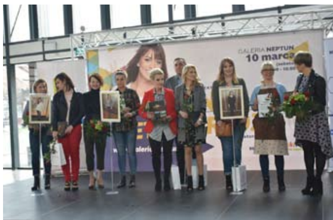
Nasze finalistki i osoby, które zadbały o ich zmiany.