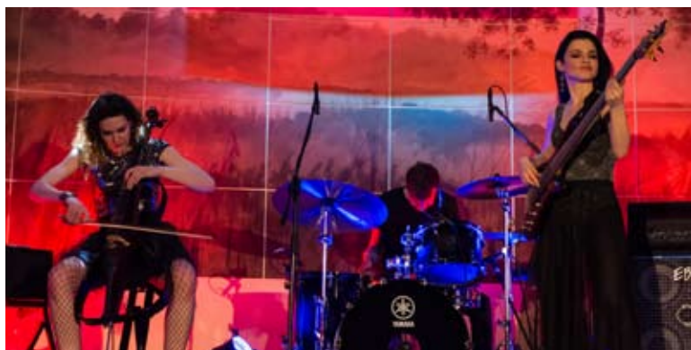
Na scenie wystąpił zespół Bass & Cello.