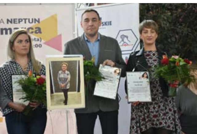
Podziękowaliśmy osobom i instytucjom, które współpracowały z nami podczas akcji.