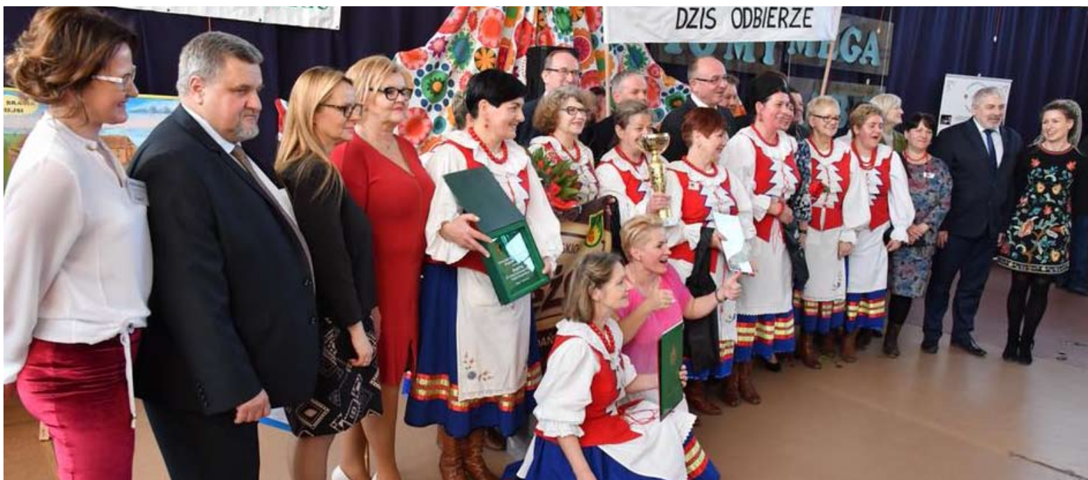
Panie z KGW Koteże wygrały turniej powiatowy.

- Bardzo cieszymy się, że po raz kolejny bierzecie udział w tej wspaniałej imprezie, która doskonale integruje całe środowisko gospodyń wiejskich i pozwala zaprezentować talenty na najwyższym poziomie - mówili. Po okolicznościowych wystąpieniach przyszedł czas na występy miejscowych uczniów i rywalizację wśród pań. Zaprezentowały się w kilku kategoriach, a każda