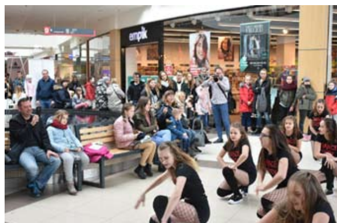
Przed publicznością wystąpiły grupy taneczne z Ogniska Pracy Pozaszkolnej.