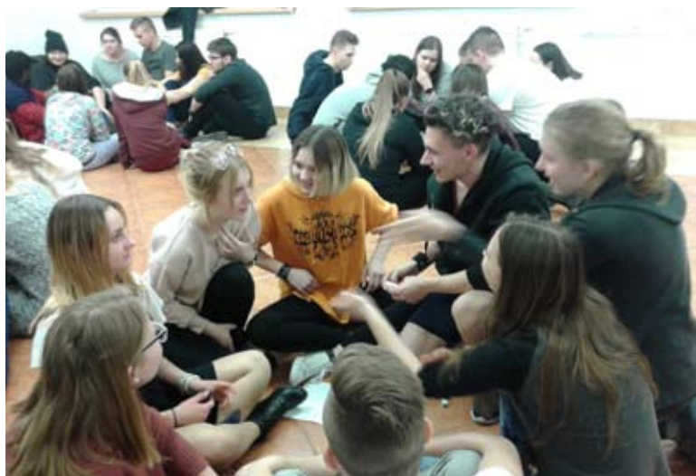
Euroweek był świetną okazją do sprawdzenia poziomu języka angielskiego, ale też rozwoju kreatywności.

poznac ich kulturę i obyczaje. Przez cały czas trwania warsztatów towarzyszyła nam niesamowita atmosfera. Wyjazd zmotywował mnie do nauki języka angielskiego. Zachęcam wszystkich do wzięcia udziału w EuroWeek! - przyznaje