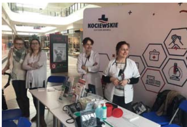
Podczas finału można było m.in. sprawdzić poziom cukru oraz zmierzyć ciśnienie.