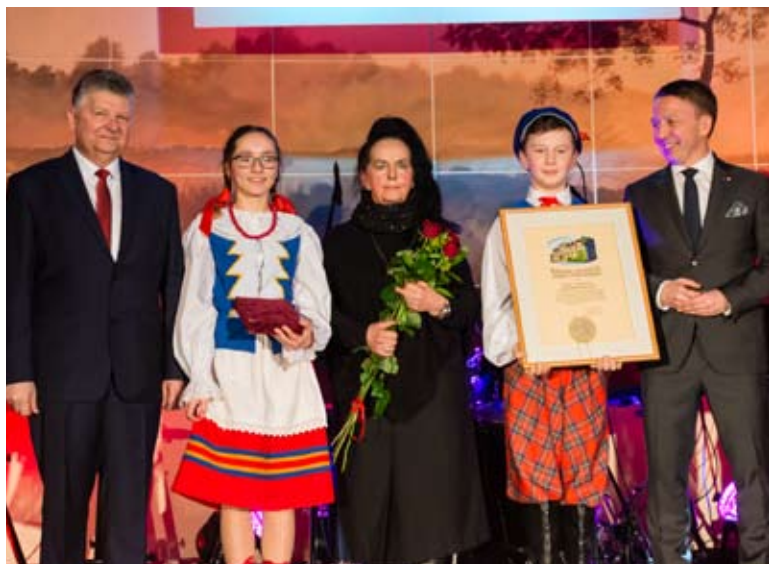
Nagrodę Specjalną przyznano Zespołowi Regionalnemu „Lubichowskie Kociewiaki”.