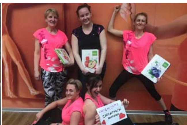
Przed wielkim finałem panie odwiedziły siłownię Neptun Gym Fitness.