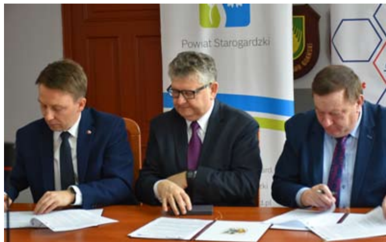
Władze Powiatu Starogardzkiego podpisały umowę z firmą Asseco Poland SA.

Przypomnijmy, że zadanie jest realizowane w ramach projektu „Poprawa jakości świadczonych usług medycznych poprzez rozbudowę systemu informatycznego i wdrożenie e-usług w Kociewskim Centrum Zdrowia sp. z o.o. w Starogardzie Gdańskim.” Wartość tego przedsięwzięcia to blisko 3,8 mln zł, a unijne dofinansowanie wynosi ponad 3 mln zł. Szpital zyska sprzęt oraz nowe funkcjonalności, które umożliwią zarządzanie placówką, usprawnią obieg dokumentacji medycznej i administracyjnej, a także pozwolą na utworzenie e-platformy Zdrowia.