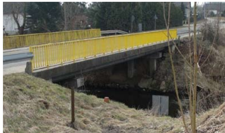
W Pogódkach do końca wakacji trwać będzie przebudowa mostu nad rzeką Wierzyca.

Kobyle, Dolne Maliki, Górę, do miejscowości Koźmin. To nie koniec dobrych wiadomości. Z kolejnej uciechą się przede wszystkim mieszkańcy Szteklina i Bietowa. Chodzi o remont drogi powiatowej. Do 10 maja br.