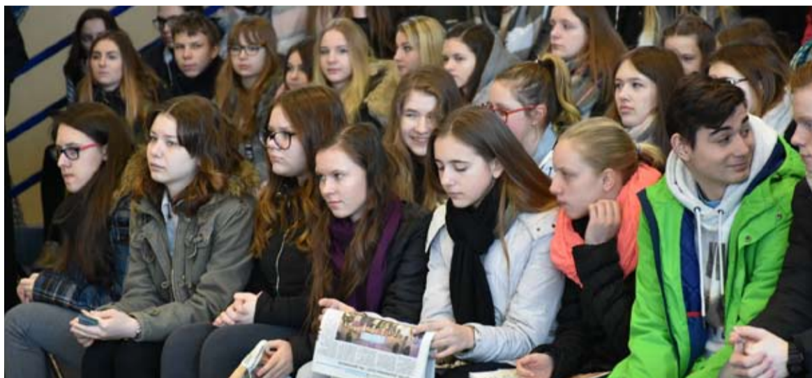
W Powiatowych Targach Edukacyjnych i Pracodawców wzięło udział blisko 1300 uczniów.

Już po raz dziesiąty odbyły się Powiatowe Targi Edukacyjne i Pracodawców, w trakcie których gimnazjaliści mogli lepiej poznać ofertę szkół średnich prowadzonych przez Powiat Starogardzki, a także spotkali się z pracodawcami.