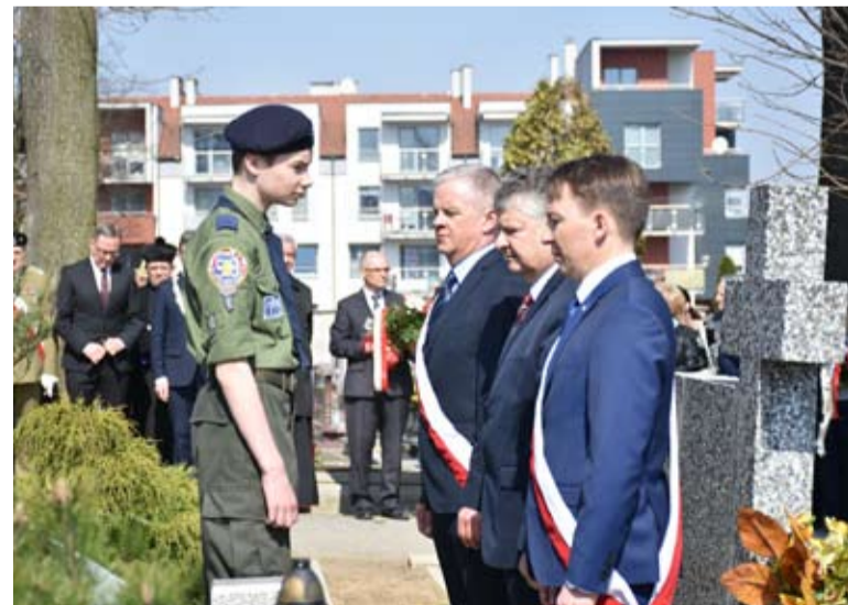
Delegacja Powiatu Starogardzkiego oddała hołd ofiarom.

13 kwietnia, jak co roku na cmentarzu przy ul. 2 Pułku Szwolżerów Rokitniańskich w Starogardzie Gd. samorządowcy, przedstawiciele najważniejszych instytucji, a także licznie zgromadzona młodzież oraz przedstawiciele stowarzyszeń i wojsko oddali hołd ofiarom tej tragicznej zbrodni. Delegacje, w tym delegacja władz Powiatu Starogardzkiego, złożyły wiązanki kwiatów.