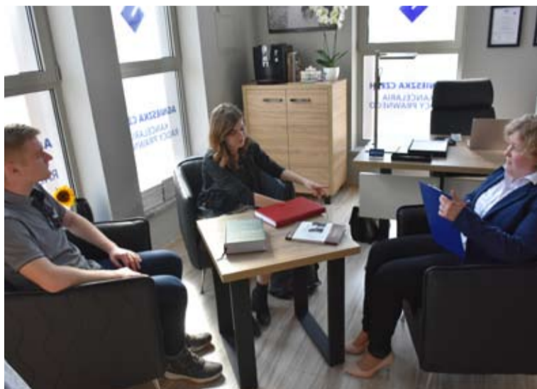
Uczniowie przyjrzeni się bliżej pracy radcy prawnego.