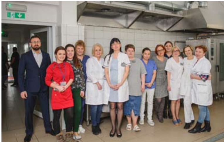
Szpital posiada wyremontowaną kuchnię.