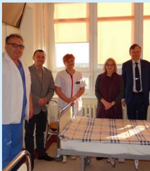
Oddział Ginekologiczno-Położniczy zyskał 18 nowych łóżek

Zarząd Kociewskiego Centrum Zdrowia serdecznie dziękuje darczyńcom za przekazane sprzęty medyczne, które przysłużą się polepszaniu jakości i bezpieczeństwa leczenia oraz zapewnią pacjentkom komfortowe warunki pobytu.