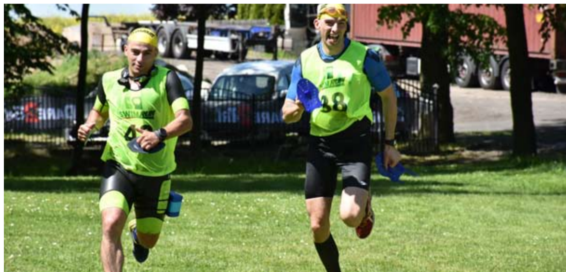
Przed rokiem po raz pierwszy Swimrun odbył się w Suminie.

Na 12 maja została zaplanowana II edycja zawodów Swimrun w Suminie. Do pokonania będą trzy trasy do wyboru.