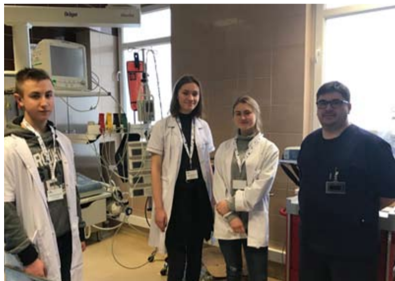
Młodzież zapoznała się ze specyfiką funkcjonowania szpitala.

zakresem obowiązków kadry oraz uzyskała wszelkie niezbędne informacje na temat funkcjonowania starogardzkiego szpitala - wy-