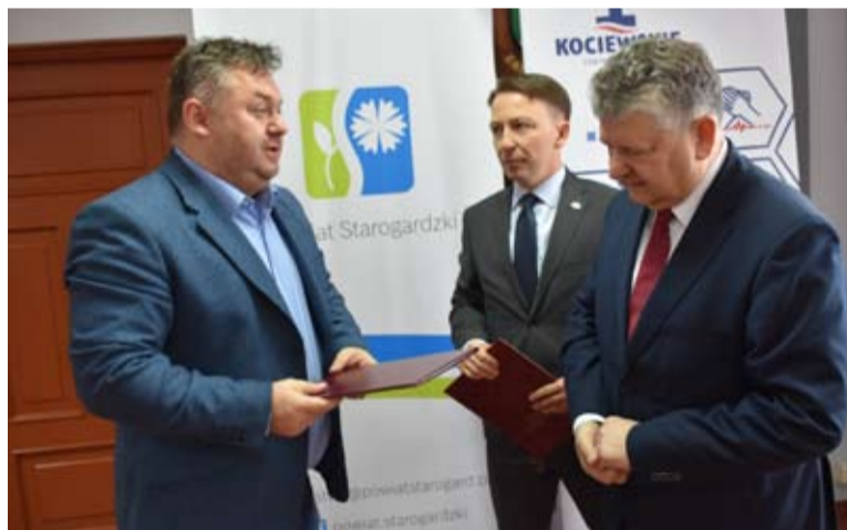
Druga umowa została podpisana z z Grupą N sp. z o.o. i dotyczy dostawy sprzętu do szpitala.

Generalnie wraz z informatyzacją pojawia się coraz więcej korzyści i dla lekarzy, i dla pacjentów. Docelowo bowiem elektroniczna dokumentacja medyczna zastąpi te tony papieru, które spoczywają w archiwach. Zarządzanie informacją będzie dużo łatwiejsze i zajmie zdecydowanie mniej czasu. Korzyści dla pacjenta będzie naprawdę dużo. W łatwy sposób będzie mógł komunikować się ze szpitalem, nie będzie już uzależniony od wykonania telefonu do placówki, ale będzie mógł sam zarejestrować się elektronicznie na konkretny termin, a następnie otrzymać przypomnienie o zbliżającym się terminie wizyty. Jak będzie potrzebny odpis dokumentacji medycznej z pobytu w szpitalu, to pacjent złoży wnio-