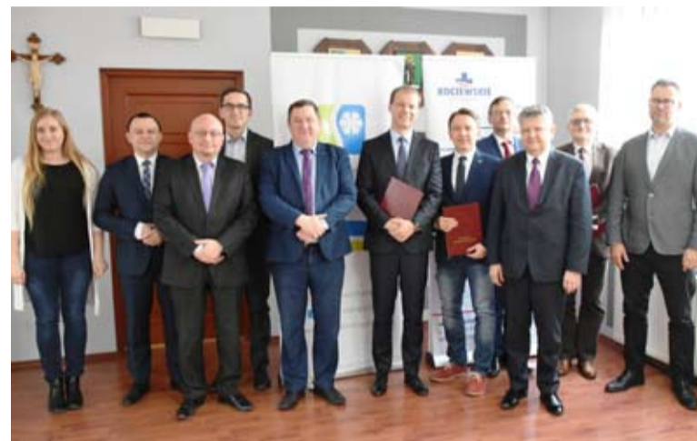
Pierwsza z umów dotyczy Szpitalnego Systemu Informatycznego wraz z integracją z posiadanymi systemami i urządzeniami.