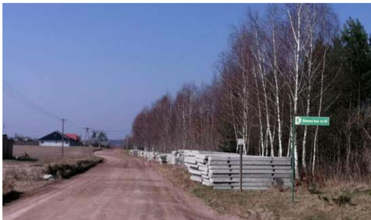
Zostanie utwardzony kilometrowy odcinek drogi.

Jedną z ważnych inwestycji Powiatu Starogardzkiego jest przebudowa mostu nad rzeką Wierzyca. Z nowego mostu na koniec tegorocznych wakacji będą się cieszyć mieszkańcy Pogódek, w gminie Skarszewy, a także wszyscy kierowcy poruszający się drogą powiatową nr 2414G. W ubiegłym tygodniu nastąpiło przekazanie placu budowy wykonawcy, którym jest firma ROKA Budownictwo Sp. z o.o. ze Starogardu Gd. Koszt zadania, którego inwestorem jest Powiatowy Zarząd Dróg, to nieco ponad 1,4 mln zł. Z tą inwestycją wiąże się ważna informacja dla kierowców. W związku z rozpoczęciem przebudowy mostu nad rzeką Wierzyca w ciągu drogi po-