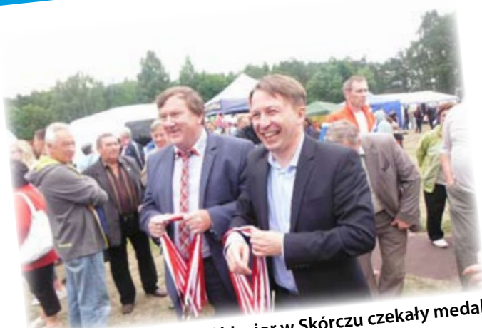
Na uczestników Biegu IV Jezior w Skórczu czekały medale.