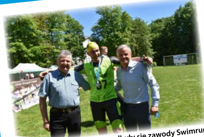
W 2017 r. po raz pierwszy odbyły się zawody Swimrun.