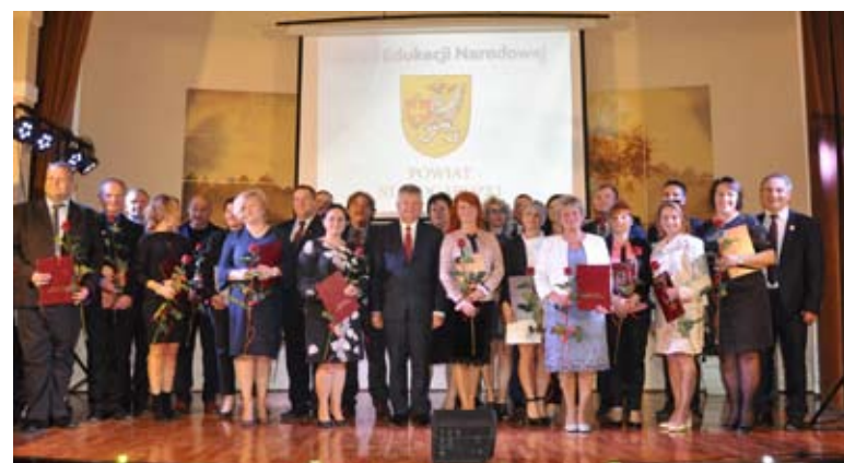
Na koniec z okazji Powiatowego Dnia Edukacji Narodowej Starosta Leszek Burczyk wręczył nagrody dyrektorom szkół ponadgimnazjalnych powiatu starogardzkiego.

- 65 lat w życiu placówki to tysiące wychowanków, całe zastępy nauczycieli, pracowników, bez których żadna placówka nie mogłaby funkcjonować - mówił starosta. - Dzisiaj trudno wyobrazić sobie funkcjonowanie naszego systemu