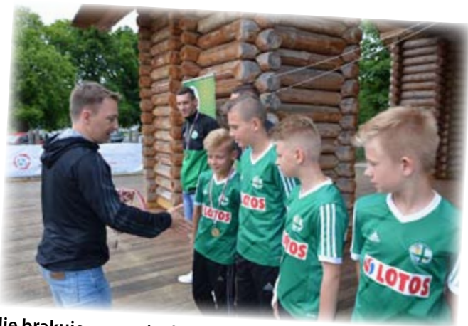
Nie brakuje wsparcia dla najmłodszych sportowców.

To był czas wielu emocjonujących zmagani sportowych w różnych dyscyplinach. Bardzo często zawodnicy mieli zagorzałych kibiców wśród władz Powiatu Starogardzkiego.