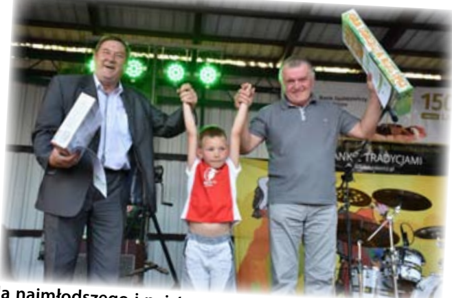
Dla najmłodszego i najstarszego uczestnika rajdu rowerowego podczas imprezy Na jagody musiały być nagrody.