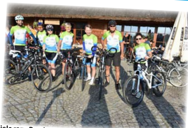
Wiele razy Powiat miał też swoich przedstawicieli w różnych imprezach sportowych, jak choćby Kociewie Kołem.