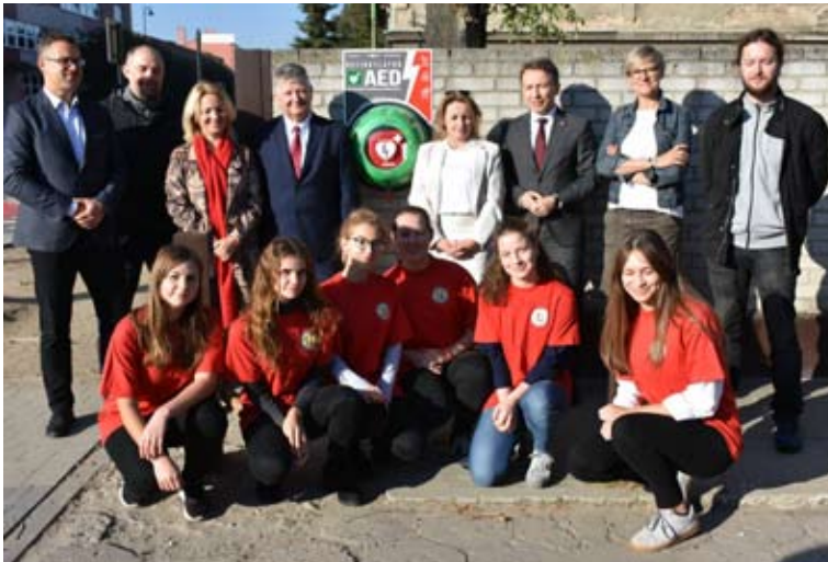
Jedno z urządzeń zostało zamontowane przy bramie wejściowej do II Liceum Ogólnokształcącego.

trzebne urządzenie, choć życzyłbym sobie, aby nigdy nie musiało być użyte.