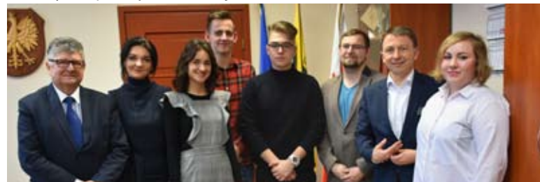
Uczniowie spotykali się z władzami Powiatu Starogardzkiego.