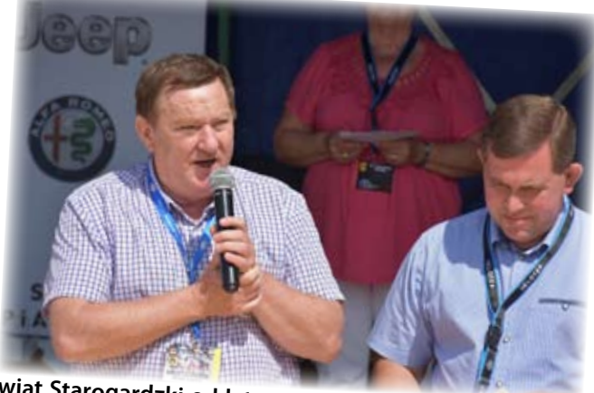
Powiat Starogardzki od lat wspiera zawody motocrossowe w Pączewie.