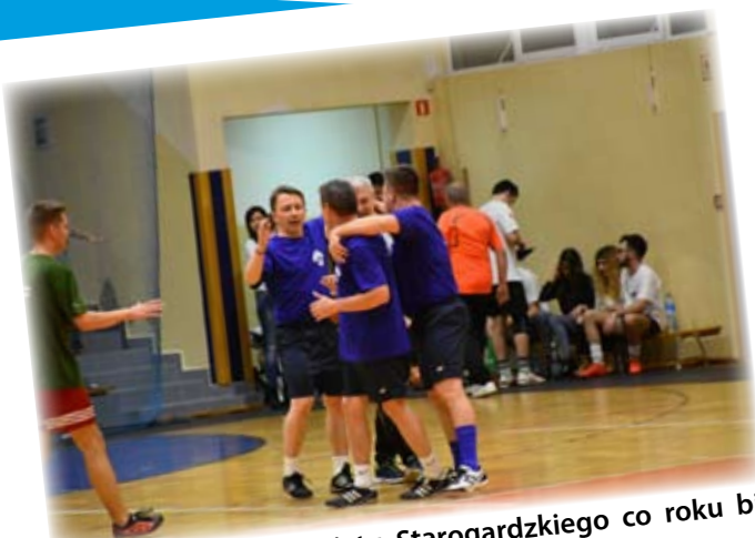
Mocna drużyna Powiatu Starogardzkiego co roku bierze udział w turnieju charytatywnym piłki nożnej.