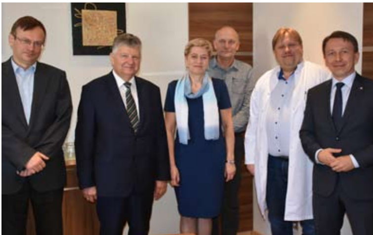
W Kociewskim Centrum Zdrowia została podpisana umowa z firmą Ewander.