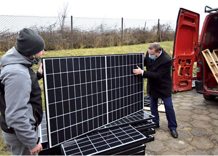
Przedsięwzięcie zakłada montaż paneli fotowoltaicznych o łącznej mocy 703 kW oraz instalację dwóch pomp o mocy 50 kW każda

getycznej w Skórczu. Zrealizowanie tej koncepcji podniesie znacząco bezpieczeństwo energetyczne miasta, poprawi bilans energetyczny i standard życia lokalnej społeczności.