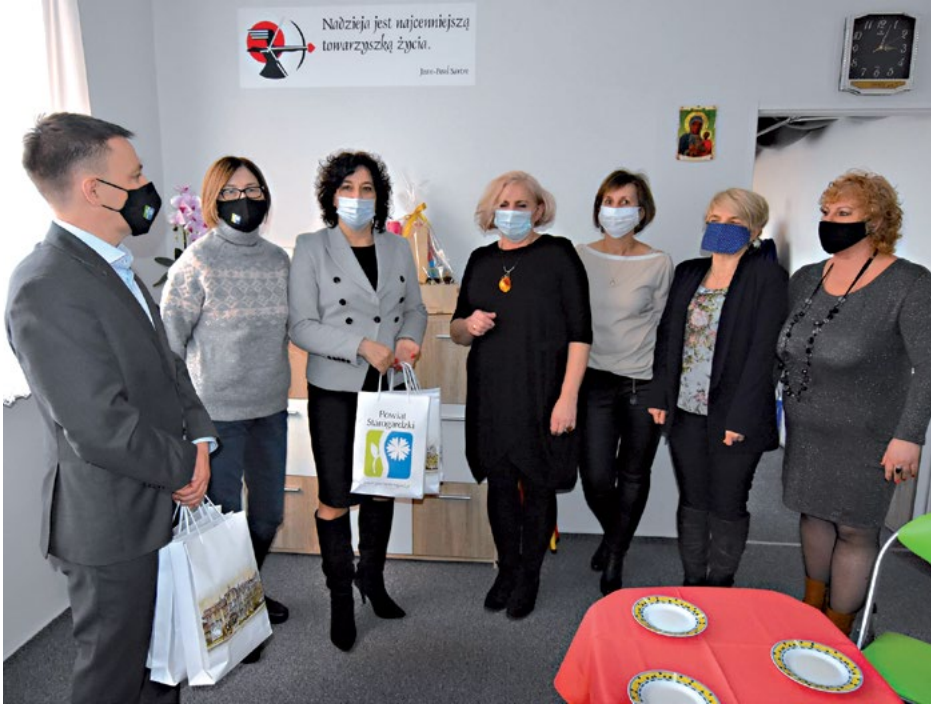
Władze Powiatu od lat doceniają działalność Amazonek.

Przypomnijmy, że do głównych zadań Rady, w której zasiadają lokalni przedsiębiorcy, należy wsparcie działań starosty poprzez wiedzę, doświadczenie oraz znajomość problemów w kształtowaniu polityki gospodarczej.