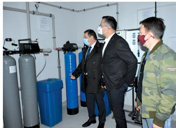
W ramach projektu zmodernizowany został cały system gazów medycznych.

Na tym jednak nie poprzestajemy - w ramach rządowych środków wymienimy zbiornik tlenu na dwukrotnie większy niż dotychczas, co pozwoli nam na zmniejszenie często-