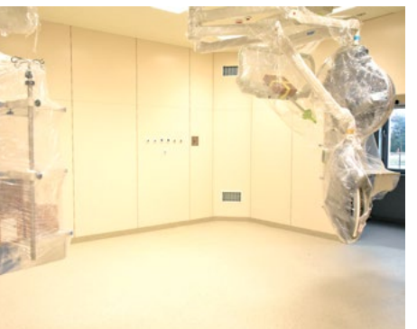
W budynku będą 3 sale operacyjne. Część sprzętu już została zamontowana.