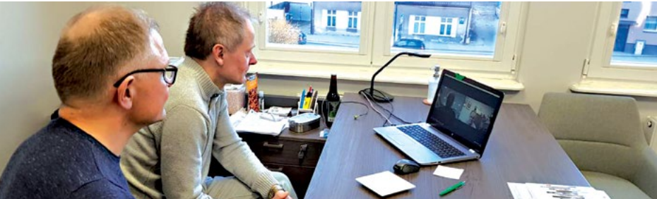
Zanim odbędzie się druga edycja, trzeba wszystko przedyskutować.