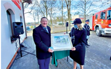
OSP w Klonówce otrzymała pojazd oraz została włączona do systemu.

TO BYŁ WAŻNY DZIEŃ DLA STRAŻAKÓW Z OCHOTNICZEJ STRAŻY POŻARNEJ W KLONÓWCE, A TAKŻE DLA DRUHÓW Z OSP W WIELKIM BUKOWCU. WSZYSTKO ZA SPRAWĄ NOWYCH SAMOCHODÓW, W KTÓRE ZOSTAŁY DOPOSAŻONE JEDNOSTKI.