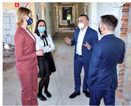
Była też okazja, aby przyjrzeć się remontowi oddziału chirurgicznego.

- Poprzednio dzięki otrzymanym środkom dostarczyliśmy do Kociewskiego Centrum Zdrowia oraz Szpitali Tczewskich środki ochrony indywidualnej i środki dezynfek-