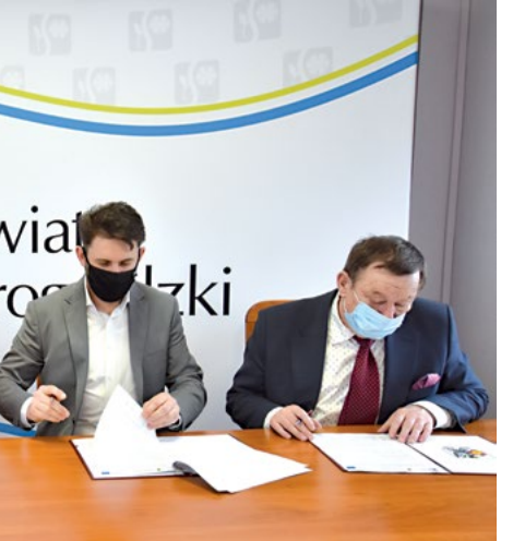
Podpisana została umowa na dostawę m.in. kardiomonitorów, defibrylatorów, aparatu RTG z ramieniem C.