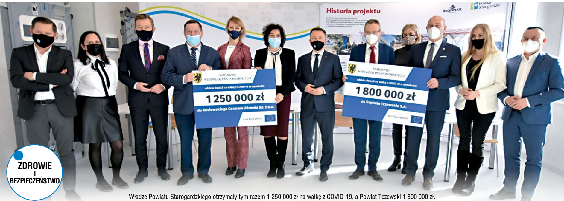
Władze Powiatu Starogardzkiego otrzymały tym razem 1 250 000 zł na walkę z COVID-19, a Powiat Tczewski 1 800 000 zł.