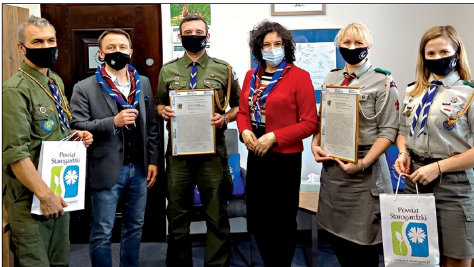
Pamiątkowe uchwały ustanawiające rok 2021 „Rokiem Harcerstwa Starogardzkiego” zostały przekazane na ręce szefostwa Chorągwi Gdańskiej oraz Hufca ZHP w Starogardzie Gd.

jest Prawo Harcerskie i składane Przyrzeczenie. Przyjaciołom dziękuję za wszystkie działania stwarzające przestrzeń dla działalności harcerskiej w znaczący sposób ułatwiających nam działalność. Dziękując za nawet najmniejsze działania, jestem przekonana, że wszyscy realizujemy posłanie Naczelnego Skauta gen. Roberta Baden Powella i zostawiamy Świat choć trochę lepszym niż go zostaliśmy.