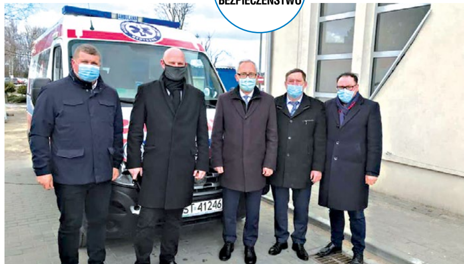
Szpital pozyskał dodatkową karetkę, która od 15 kwietnia stacjonuje w Skarszewach.

Tę lokalizację zgłosiły władze miasta Starogard. W tej sytuacji władze Powiatu zadeklarowały - w miarę możliwości i rozwoju sytuacji pandemicznej w KCZ - wsparcie personelu dla tego punktu.