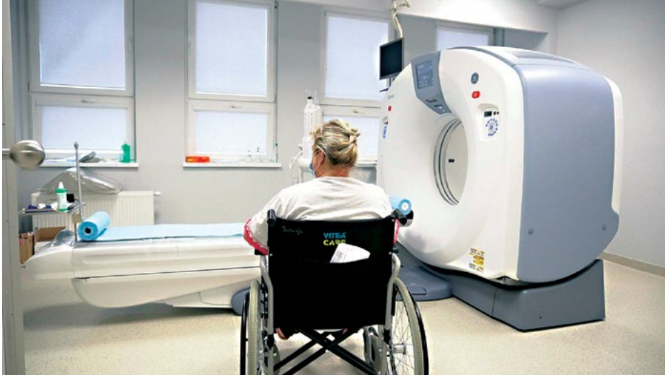
Zakład Diagnostyki Obrazowej powstał zupełnie od podstaw. Wartość samego sprzętu to ponad 6 mln zł.

ultrasonograf, respirator, defibrylator czy zestaw komputerowy z oprogramowaniem holterowskim, które zasilą wyposażenie nowoczesnych pracowni badań holterowskich EKG i ultrasonografii dopplerowskiej oraz pracowni elektrofizjologicznej.