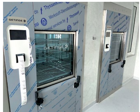
Oddziały szpitalne, gabinety zabiegowe, a w szczególności blok operacyjny - do sprawnego funkcjonowania i opieki nad pacjentem potrzebują wsparcia centralnej sterylizacji.

Oddziały szpitalne, gabinety zabiegowe, a w szczególności blok operacyjny - do sprawnego funkcjonowania i opieki nad pacjentem potrzebują wsparcia centralnej sterylizacji, tak aby narzędzia i sprzęty medyczne były zdezynfekowane i sterylne czyste na czas oraz w najwyższym standardzie bezpieczeństwa epidemiologicznego, jeszcze