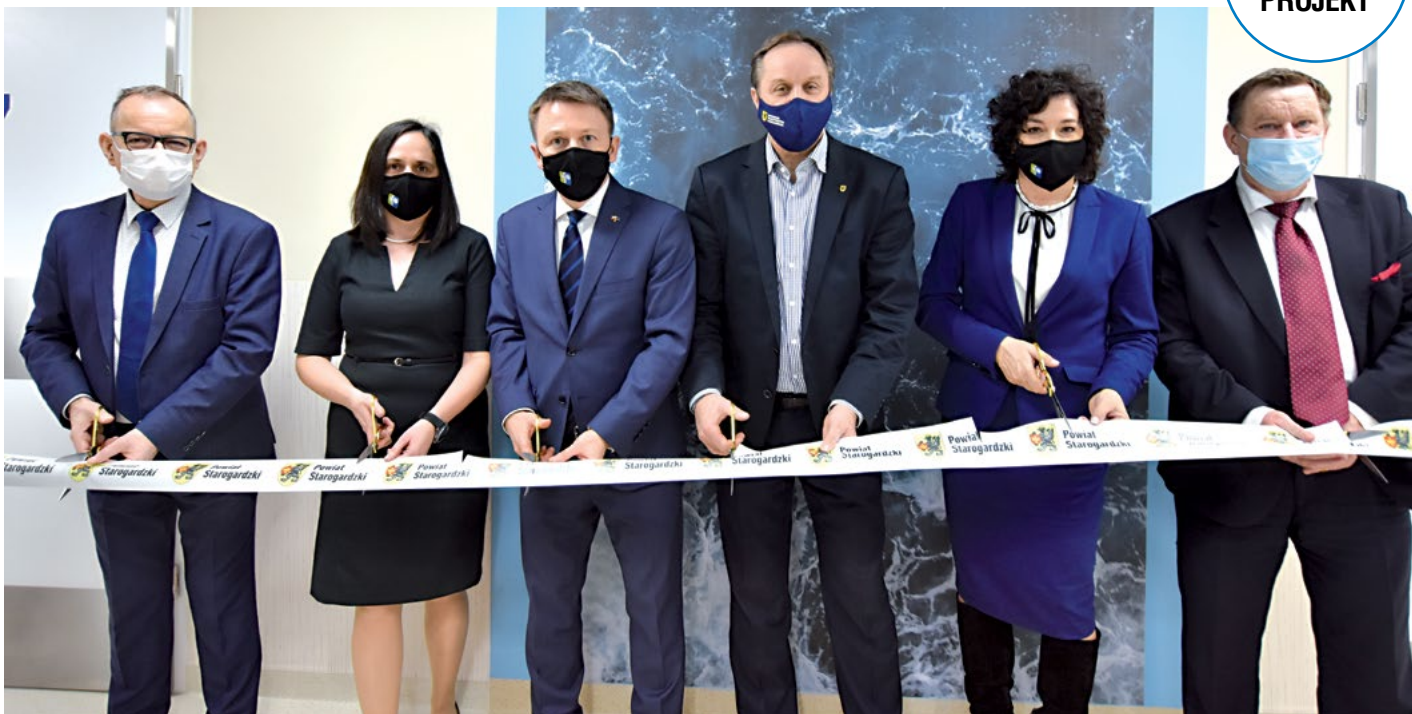
Oddział neurologiczny już działa w nowoczesnych warunkach. Modernizacja trwała 8 miesięcy.

- Kupiliśmy m.in.: 18 łóżek, w tym 2 do intensywnego nadzoru, a także kozetki, szafy medyczne, wyposażenie meblowo-biuroowe –