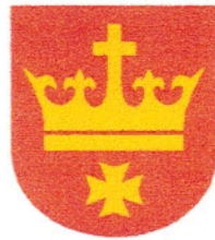
Gmina Miejska Starogard Gdański